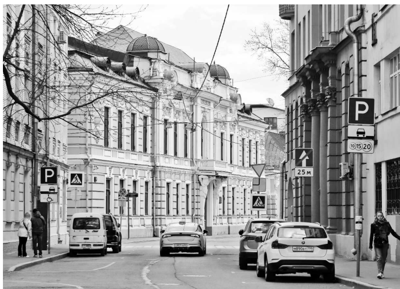
Особняк Морозовых в Подсосенском переулке