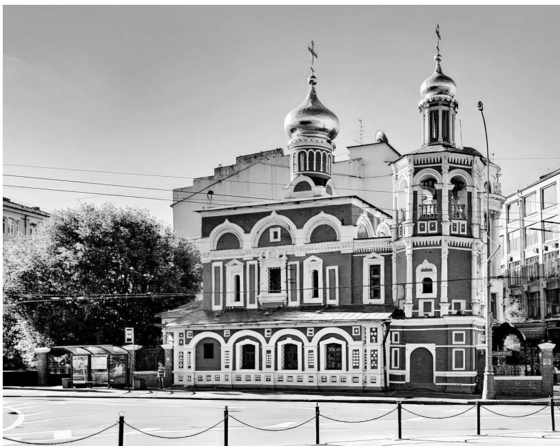
Церковь на Кулишках