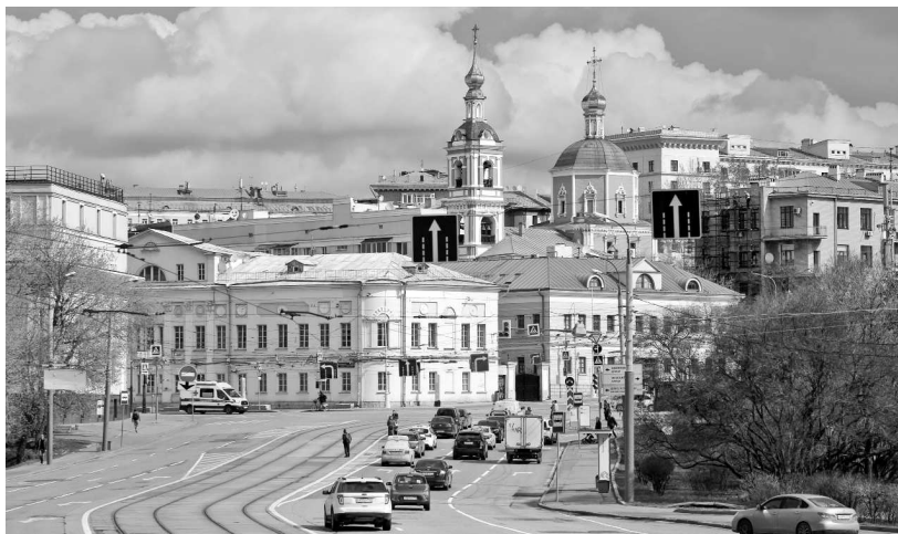
Площадь Яузские Ворота

Даже огромный жилой «Соляной» дом в шесть этажей и аж пятнадцать подъездов, громадина, случайно попавшая в неспешное старинное царство, готов удивить прохожего: здесь снимали сцены фильмов «Брат 2» и «Через тернии к звездам». На первом этаже открыто столько кафе, что за день все не обойдешь, а в громадных подвалах прячутся тайные комнаты.