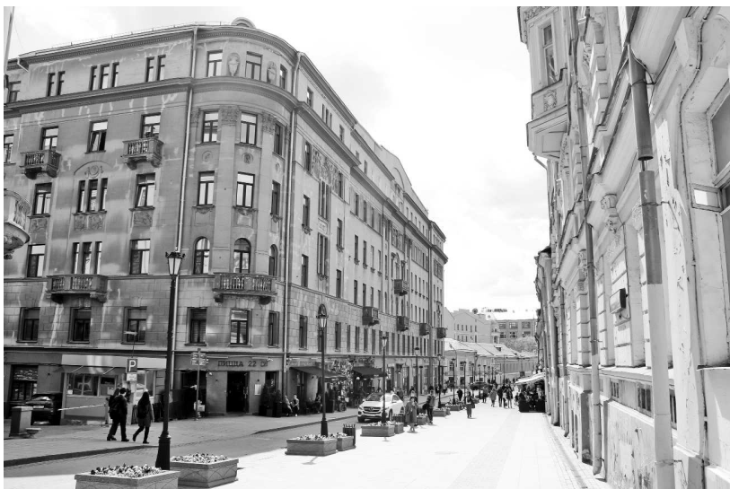
Соляной дом на Забелина