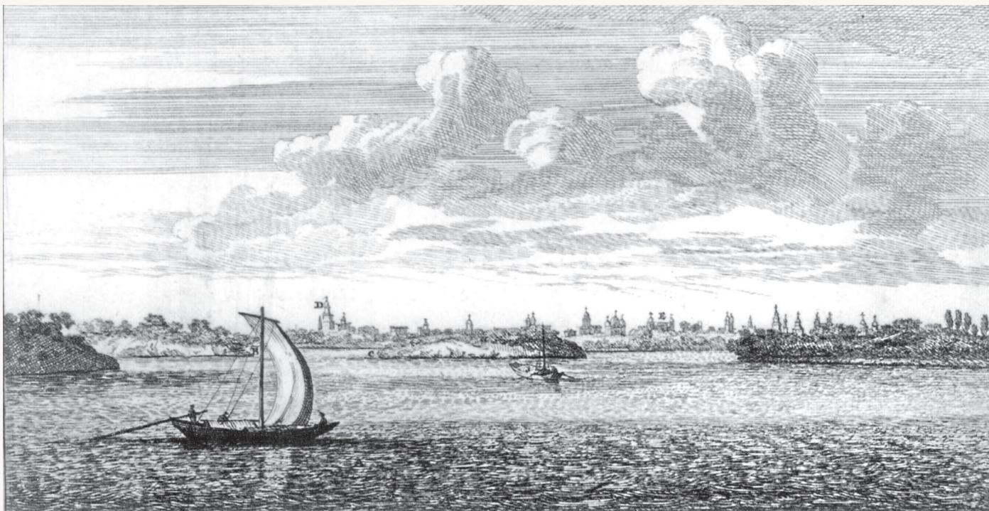
▲ Панорама Великого Устюга из книги Корнелия де Бруина «Путешествие через Московию». Начало XVIII в.