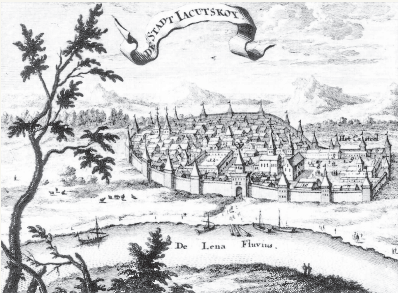
▲ Якутск – гравюра голландского картографа Николаса Витсена. Конец XVII в.