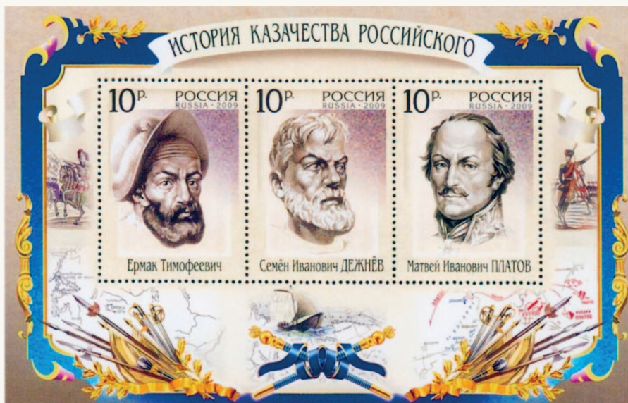
▲ Почтовый блок «История казачества России»

Два года спустя, весной 1645-го, Стадухин и Зырян надумали ехать в Якутск, чтобы отвезти собранный ясак и отчитаться перед начальством. С собой они забрали половину казаков. В остроге остались 13 человек, включая Дежнёва. Едва слух об отъезде части казаков разнесся по округе, более 500 юкагиров осадили острог. Сдержать их натиск «огненным боем» не удалось. Туземцы ворвались за частокол, началась рукопашная схватка. Спротивлялись казаки отчаянно. Они все были изранены, Дежнёв получил железную стрелу в голову, но продолжал сражаться. В конце концов казакам удалось заколоть предводителя юкагиров. Гибель вождя