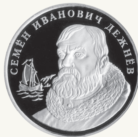
▲ Монета Банка России с изображением Семена Дежнёва из серии «Первопроходцы земли русской»

По новому сухому пути прибыли к зимовью Дежнёва партии