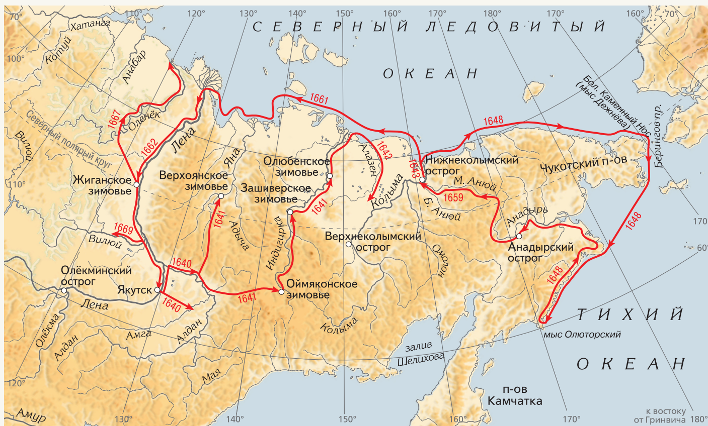
▲ Карта походов Семена Дежнёва 1640–1668 гг.

красной рыбы в реках, состоянии льдов в море, границе березовых и лиственничных лесов. В устье Анадыря он обнаружил отмель с большим лежбищем моржей, и казаки начали промысел моржовой кости, которая стала главным достоянием Анадырского острога.