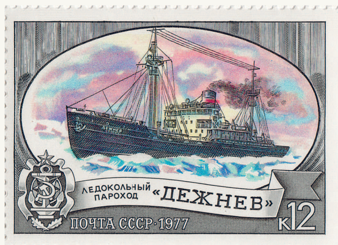
◀ Почтовая марка ледокольный пароход «Дежнёв»

Летом 1643 года казаки на кочах снова вышли в море. На сей раз их целью стала «досель неизвестная» река Колыма, которая, судя по рассказам местных, была обильна рыбой и зверем. В июле суда казаков вошли в устье Колымы. Немного подняв-