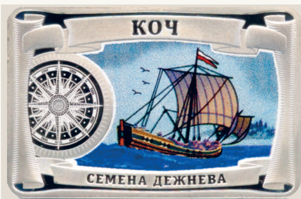
▲ Серебряный жетон с изображением коча Семёна Дежнёва. Из серии «Самые красивые корабли мира»