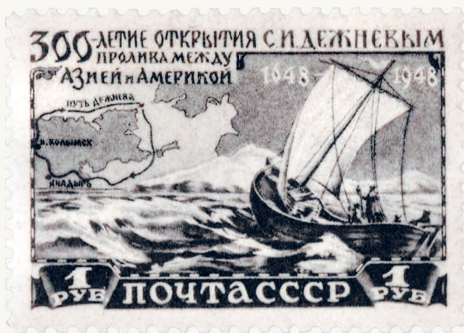
◀ Почтовая марка, выпущенная к 300-летию плавания Семена Дежнёва

Двинского уезда. Весьма вероятно, что Семен Иванович Дежнёв происходил из пинежских крестьян-поморов. Примерной датой его рождения принято считать 1605 год.