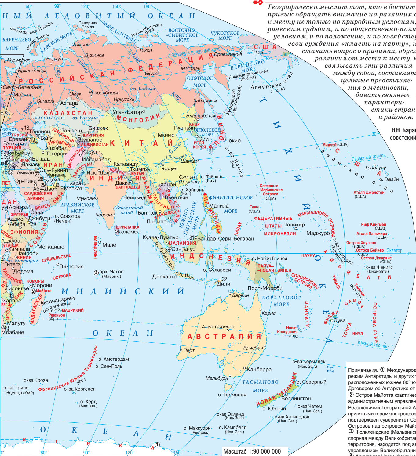
Масштаб 1:90 000 000

Примечания. ① Международно-правовой режим Антарктиды и других территорий, расположенных южнее 60° ю. ш., регулируется Договором об Антарктике от 1 декабря 1959 г. ② Остров Майотта фактически находится под административным управлением Франции. Резолюциями Генеральной Ассамблеи ООН, принятыми в рамках процесса деколонизации, подтверждён суверенитет Союза Коморских Островов над островом Майотта. ③ Фолклендские (Мальвинские) Острова — спорная между Великобританией и Аргентиной территория, находится под административным управлением Великобритании. ④ Архипелаг Чагос фактически находится под административным управлением Великобритании. Резолюциями Генеральной Ассамблеи ООН, принятыми в рамках процесса деколонизации, архипелаг признаётся неотъемлемой частью территории Маврикия. ⑤ Территории Палестины (Западный берег реки Иордан и сектор Газа) оккупированы Израилем в 1967 г. В настоящее время в рамках мирного урегулирования на Ближнем Востоке идёт процесс формирования Государства Палестина. Функцию административного центра Палестины временно выполняет Рамалла. ⑥ Столицей Израиля является Западный Иерусалим. Вопреки резолюциям Генеральной Ассамблеи ООН Израиль считает своей столицей весь Иерусалим, что не признаётся большинством стран мира. Политическое устройство мира отражено по состоянию на март 2026 г.