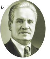
Н.Н. Баранский (1881–1963) советский учёный-географ

« Географически мыслит тот, кто в достаточной мере привык обращать внимание на различия от места к месту не только по природным условиям, но и по историческим судьбам, и по общественно-политическим условиям, и по положению, и по хозяйству, кто привык свои суждения «класть на карту», кто привык ставить вопрос о причинах, обуславливающих различия от места к месту, кто привык связывать эти различия между собой, составлять цельные представления о местности, давать связные характеристики стран и районов. »