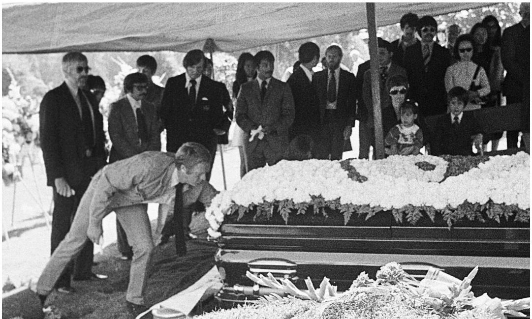
Стив Маккуин кладет свои перчатки в гроб Брюса. Слева Джеймс Коберн; справа сидят Линда, Шеннон и Брэндон Ли. Похороны в Сиэтле, 30 июля 1973 года