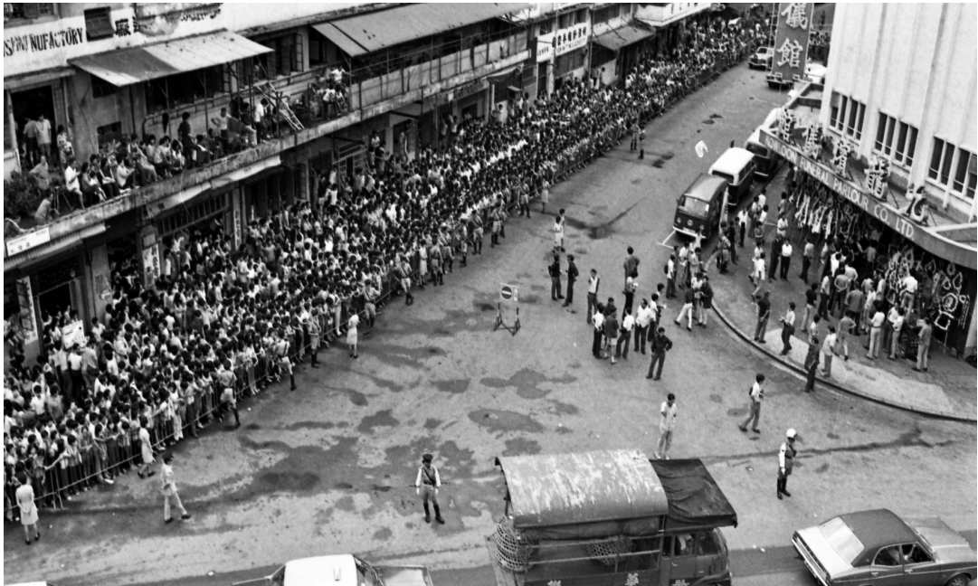
Толпа около похоронного зала в Коулуне. Похороны Брюса Ли в Гонконге, 25 июля 1973 года