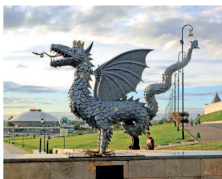
Крылатый змей Зилант — символ Казани