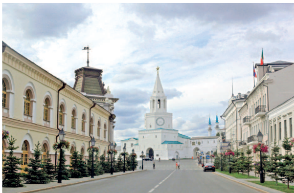
Вид на Спасскую башню со стороны Кремлевской улицы

День второй. Этот день рекомендуем начать с прогулки по Старо-Татарской слободе (▷ 40). Познакомьтесь со старинными домами и усадь-