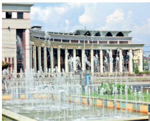
Площадь фонтанов перед Театром им. Г. Камала

Если вы держите в руках этот путеводитель, то, скорее всего, вы еще не были в третьей столице России. Но, вероятно, вы планируете визит в этот тысячелетний и одновременно такой молодой город. Мы постарались передать на его страницах всю красоту и энергетику города, пропитанного историей, легендами и событиями мирового масштаба.