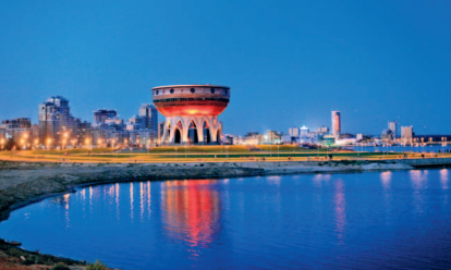
Панорама новых районов Казани