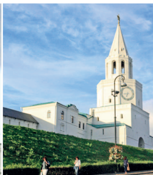
Спасская башня — главные ворота Кремля

Улица Баумана заполнена людьми в любое время суток