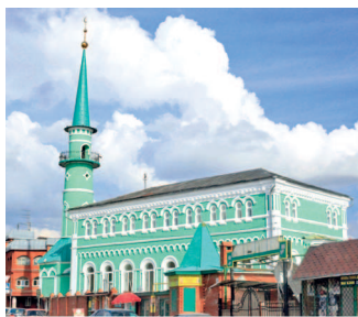
Одна из красивейших мечетей Казани — Султановская, основанная в 1868 году