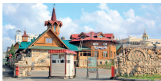
Татарская деревенька «Туган авылым» в центре города