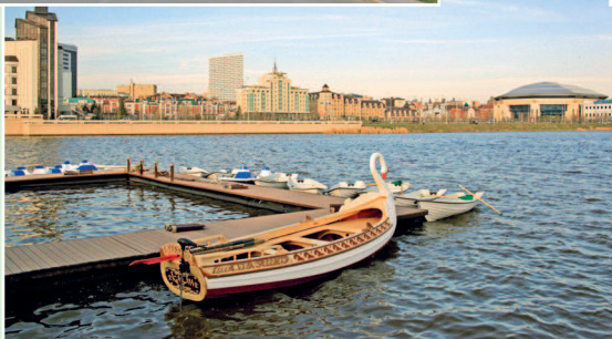
Прогулочные лодки ждут туристов на набережной озера Кабан