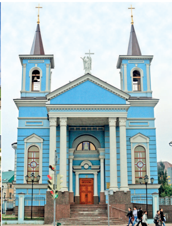
Католический храм Воздвижения Святого Креста