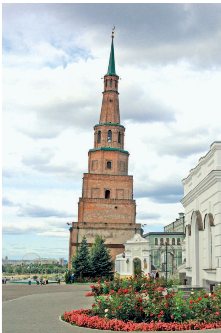
Падающая башня Сююмбике

Улица Баумана заполнена людьми в любое время суток