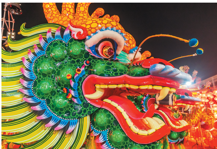
Голова китайского кукольного дракона. Китай