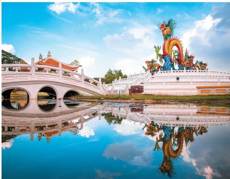
Золотой танцующий дракон. Суан-Саван, Таиланд