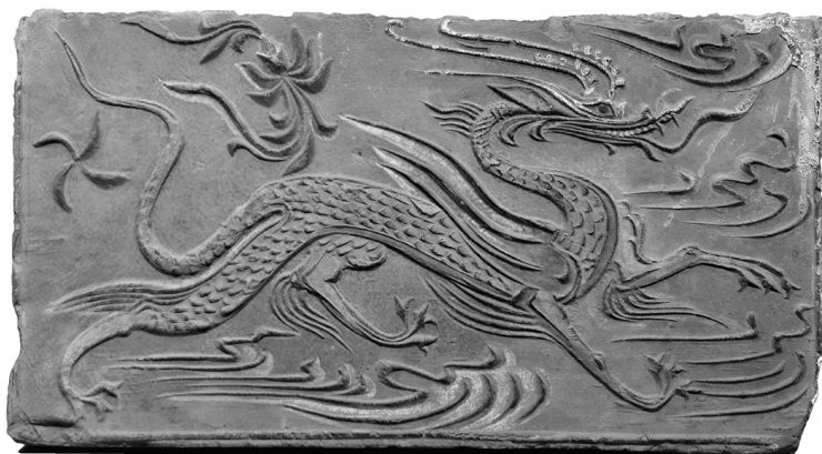
Неизвестный автор. Кирпичный рельеф крылатого дракона эпохи Южной династии. Ок. 420–479 гг. Музей провинции Хунань. Чанша, Китай

облике создан для сражения: у него длинная сильная шея и мощный хвост, способный одним ударом сбить врага с ног или разрушить постройку; переливающаяся подобно доспехам чешуя; острые когти, которыми он может разорвать на куски самое толстокожее животное. У некоторых драконов есть крылья, у других — рога, а количество голов, хвостов и лап меняется в зависимости от фантазии создателя мифа или легенды.