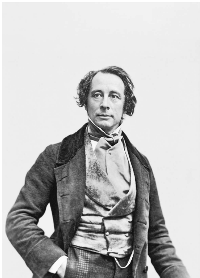
Антуан Клоде. Чарльз Диккенс