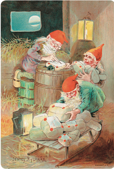
Йенни Нюстрём. Рождественская открытка. Ок. 1899 г. Национальная библиотека Норвегии. Осло