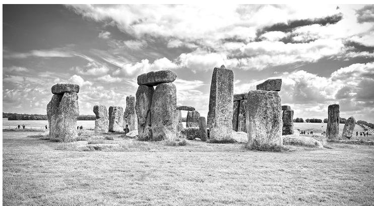
Стоунхендж. Графство Уилтшир, Великобритания

Зимнее солнцестояние иногда называют «полночью года». Это самая длинная ночь в году — время, когда, по поверьям германцев и кельтов, граница между мирами становилась тонкой и духи выходили на землю. Это было опасное, но и священное время. Вместе с тем солнцестояние символизировало на-