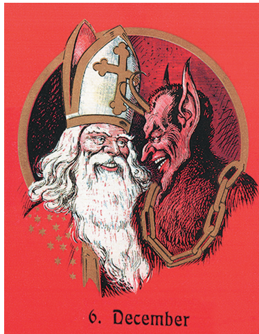
Неизвестный автор. Открытка Николаус и Крампус. Нач. XX века. Австрия