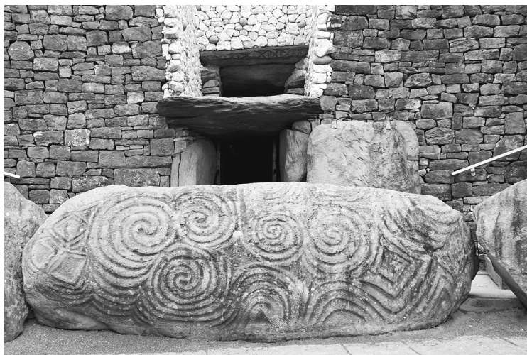
Вход в Ньюгрейндж. Дублин, Ирландия

О важности солнцестояния свидетельствуют мегалитические памятники — Стоунхендж и Ньюгрейндж. Эти древние сооружения ориентированы по солнечным линиям 21 декабря. Особенно впечатляет Ньюгрейндж в Ирландии: в утренние часы зимнего солнцестояния солнечный луч проникает в узкий проход и освещает внутреннюю погребальную камеру. Для своего времени это технологическое и сакральное чудо.