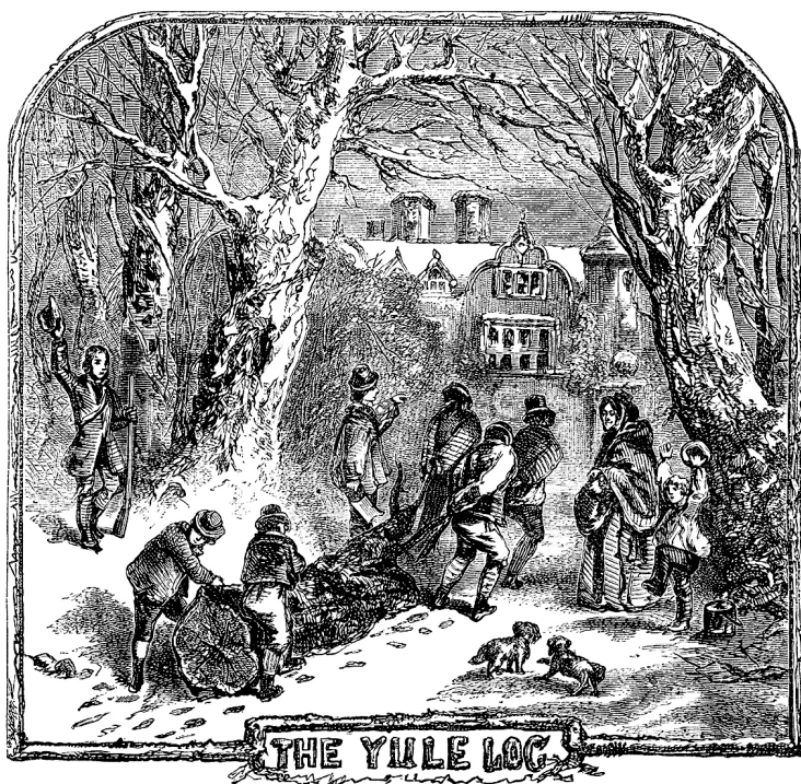
Роберт Чемберс. Перевозка бревна на Йоль. «Книга дней». 1864 г.

дежду: с этого момента дни начинали удлиняться, а свет — возвращаться. Сегодня мы знаем, что в это время Земля находится на максимальном удалении от Солнца. Но для древних народов исчезновение солнечного света означало, что боги могут быть разгневаны или разочарованы. Это время воспринималось как испытание, когда миру угрожает хаос, и люди должны были задобрить высшие силы обрядами, жертвами и молитвами, чтобы вернуть гармонию и восстановить порядок.