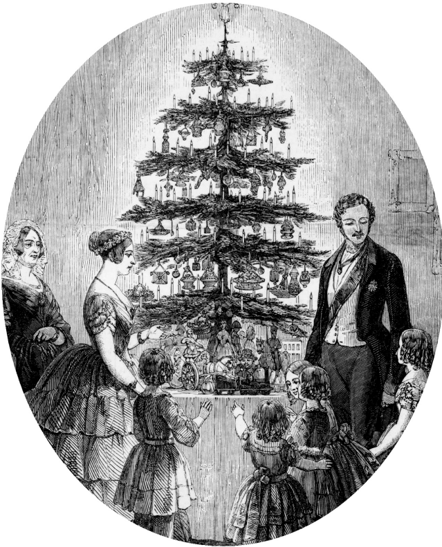
Рождественская елка в Виндзорском замке. The Illustrated London News, 1848 г.

Н а чердаке рождественского музея в волшебном городе, где живет самый настоящий Санта-Клаус, стоит тяжелый сундук. В нем спрятан драгоценный ларец, в ларце — резная шкатулка, а в ней — потерянная книга. На книге — золотой замочек, который открывается только золотым ключиком, хранящимся в кармане пальто главного эльфа музея. А сам эльф — не простой, а старший хранитель праздничных тайн. На