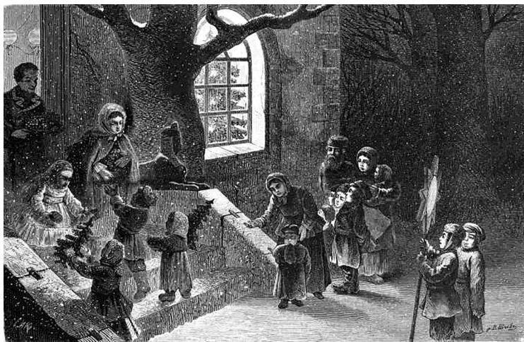
Неизвестный автор. Ночь на Рождество в деревне. «Всемирная иллюстрация», № 52, 1872 г.

Эта книга под замком неспроста: стоит лишь открыть ее, как на волшебных страницах оживает многовековая история Рождества на планете Земля. Тут и младенец Иисус в яслях, и шумные римские Сатурналии, и «сахарные банкеты» при дворе Елизаветы I — королевы Англии XVI века, при которой Рождество вновь стало официальным праздником после периода пуританского запрета, и веселые маскарады, и сверкающая царская елка в Александровском дворце в Царском Селе. Все бегают, суетятся, украшают дом хвойными ветками, развешивают на елке яблоки, пряники и стеклянные шары. Такова история Рождества — яркая, многогранная и неповторимая для каждого.