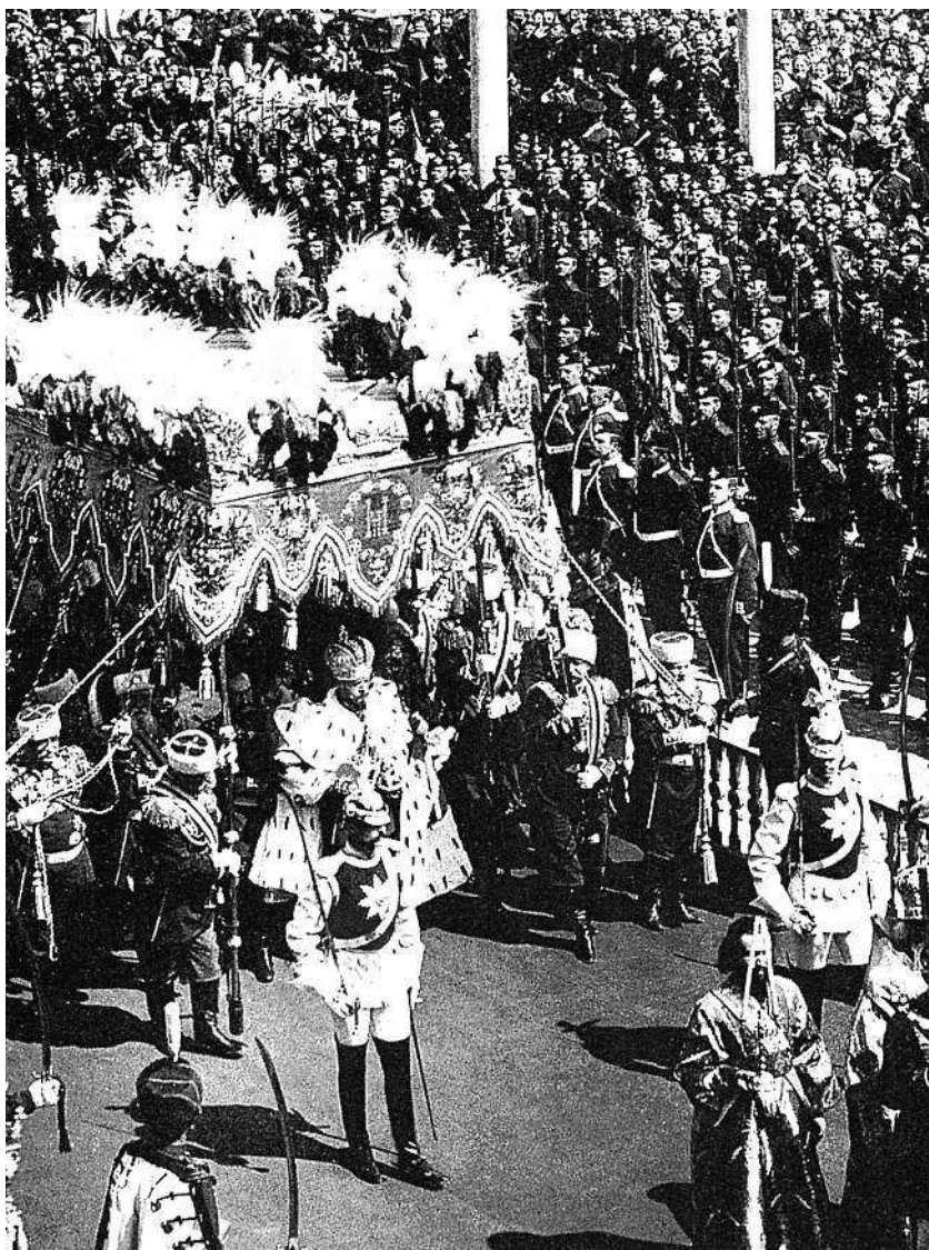
Маннергейм (на первом плане) при коронации Николая Второго 14 мая 1896 года