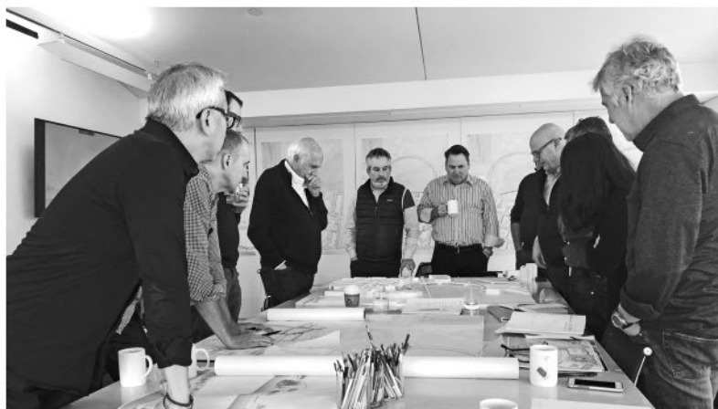
Встреча с клиентами в нашем офисе, 2019 г.: рассмотрение проекта нового кампуса для Meta/Facebook, строительство которого планируется в Менло-Парк, Калифорния

концепцию и получили одобрение, и теперь начинается этап эскизного проектирования. От инженеров получены новые данные с различными вариантами улучшения геометрии. Через зал наша команда по дизайну интерьеров компонует образцы и цветовые гаммы ковров, кафеля и дерева для больницы, которую мы строим в Картахене, Колумбия. Потом мы рассматриваем палаты, приемные и рестораны.