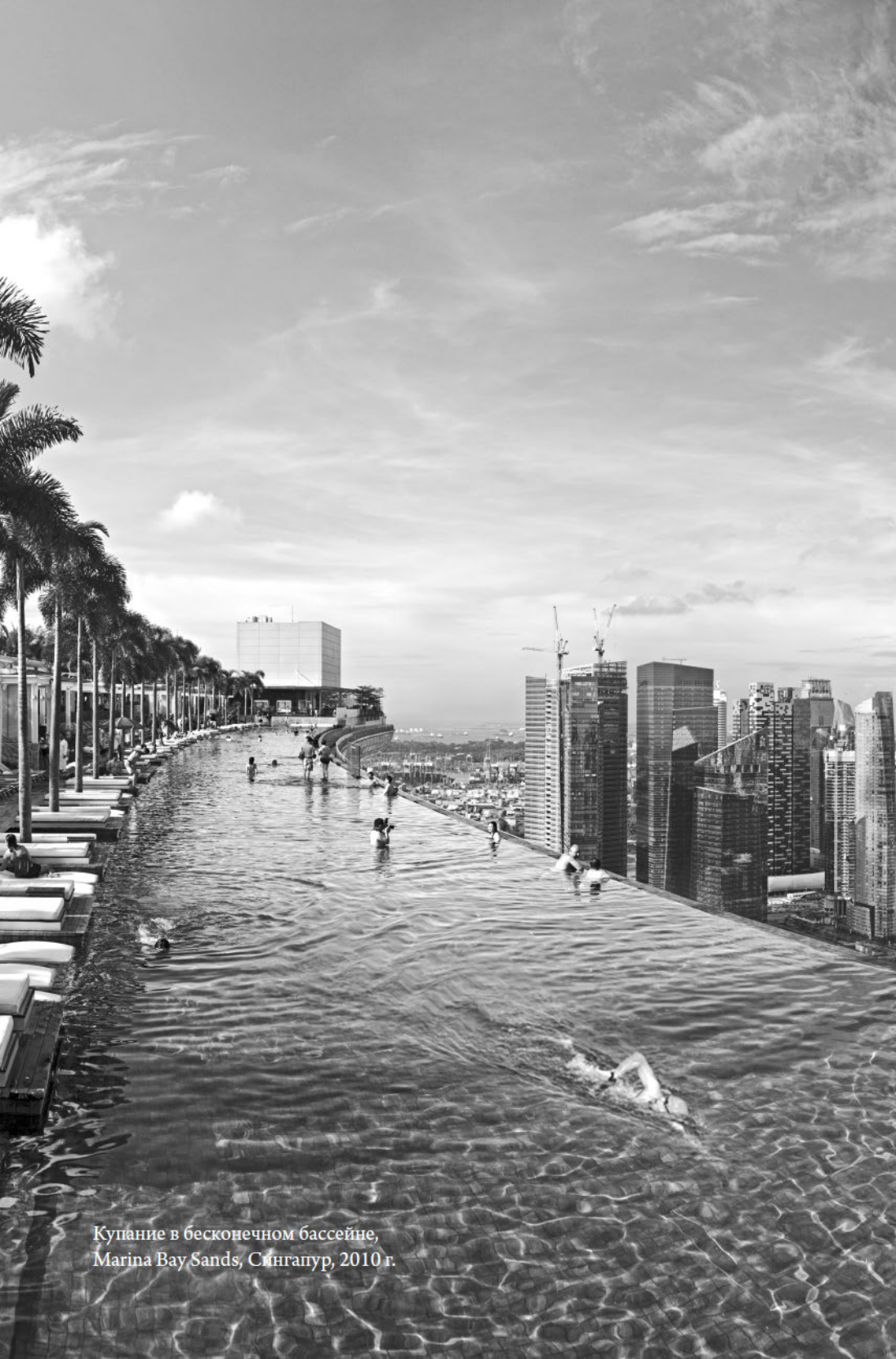
Купание в бесконечном бассейне, Marina Bay Sands, Сингапур, 2010 г.