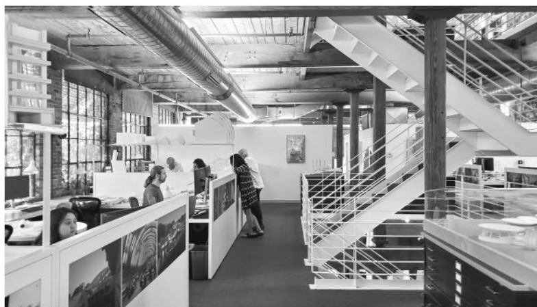
Наши офисы в помещении бывшей фабрики и склада в Сомервилле, Массачусетс, непосредственно над железной дорогой из Кембриджа

шую часть дня я провожу не в своем кабинете, а перехожу от стола к столу, встречаюсь с одной группой за другой, показываю наброски, сделанные накануне вечером или привезенные из поездки, или сижу с коллегой за монитором компьютера и наблюдаю, как разрабатывается замысел и какой вид он приобретает в трехмерном изображении.