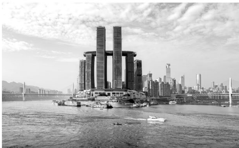
Рафлз-Сити в Чунцине, Китай, 2020 г.: восемь башен на «стрелке», известной как Пристань Императора

тегическом месте — площади Чаотяньмэнь. Здесь встречаются реки Янцзы и Цзялинцзян, формируя клин, немного похожий на оконечность Нижнего Манхэттена, — он известен как Пристань Императора. Это самое символическое место в городе. Проект выиграл конкурс, в котором мы участвовали вместе с CapitaLand, ведущей активную застройку в Китае.