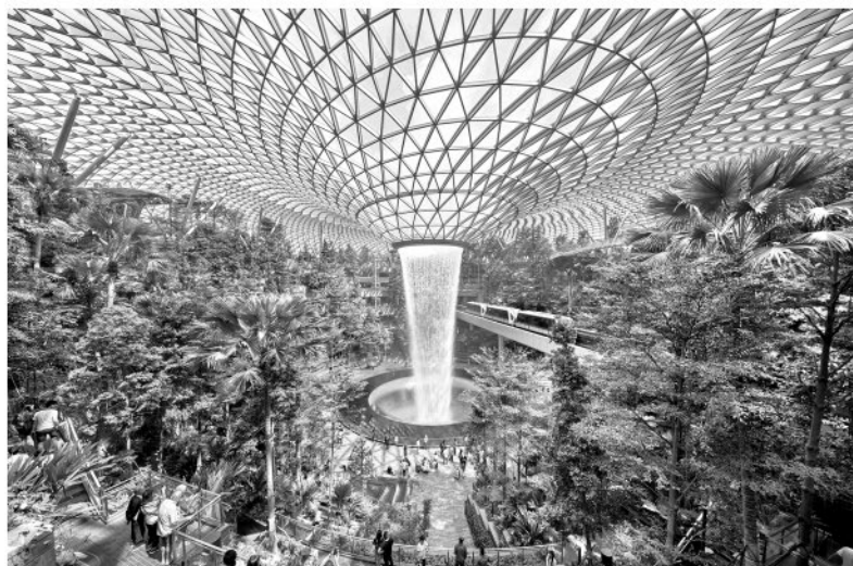
Крытый водопад в Jewel Changi, Сингапур

ного света. Внутренняя часть просторна и многослойна: мостики и открытые лестницы обеспечивают беспрепятственный обзор. Отовсюду на любом этаже видно, что делается в остальной части помещения на этом уровне, а из различных мест на любом этаже можно увидеть участки других этажей. Интересно, что бы сделал из этого места художник Мауриц Корнелис Эшер?..