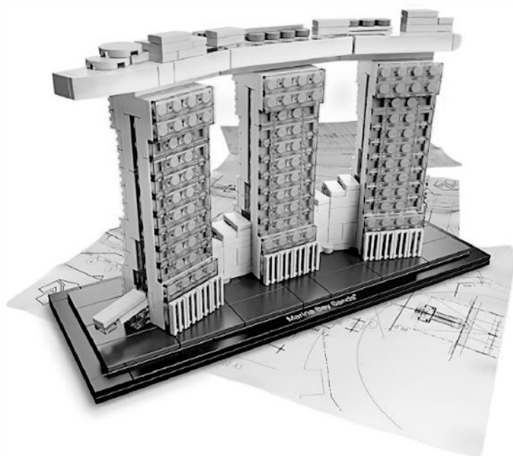
Marina Bay Sands, воспроизведенный в LEGO

Пятница — последний день перед длительной поездкой. Как всегда в такие дни, торопливо стараемся проверить все, что надо сделать. Мы напряженно работаем над презентацией, которую я собираюсь провести в Сингапуре для Управления по перепланировке города (Urban Redevelopment Authority, URA) — это касается большой пристройки к Marina Bay Sands. 3D-принтер загружен до предела, как и макетная мастерская: там заканчивают модель и готовят ее к поездке. Почти все видели архитектурные модели, но лишь немногие задумывались о том, что приходится