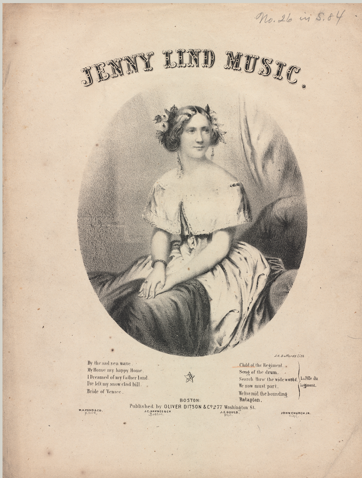
Альбом «Музыка Дженни Линд», Бостон, ок. 1850

к зрителям и «была разорвана на куски охотниками за реликвиями» 1 . Стиль Дженни Линд широко имитировали модные дамы, и некоторые историки моды даже считают ее ответственной за популяризацию трехъярусных юбок в начале 1850-х годов. Медийная вакханалия, окружавшая Линд, ее безумные фанаты и официальная сувенирная продукция были неслыханными для музыканта. Сравниться с этим мог только энтузиазм, окружавший пианиста Ференца Листа десятилетием раньше. Карьера Линд особенно важна как прототип иконографии поп-культуры, безумства фанатов и хайпа, в полной мере проявившихся в период «битломании» 1960-х годов и других похожих феноменов XX века.