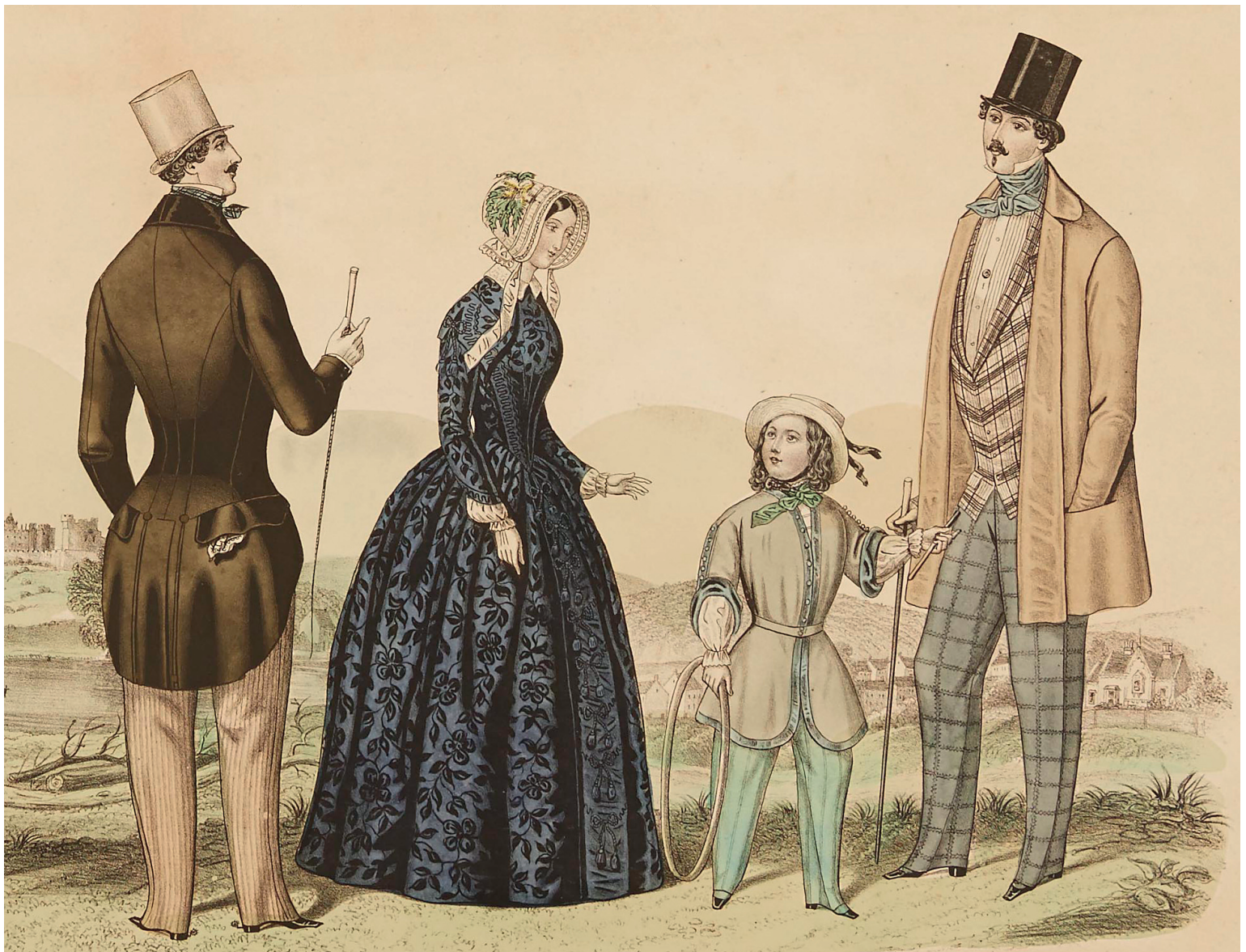
На этой иллюстрации из журнала American Fashions 1847 года представлена семья в типичной для середины XIX века одежде.

К середине XIX века Париж был бесспорным центром моды, несмотря на турбулентное состояние французской политики.