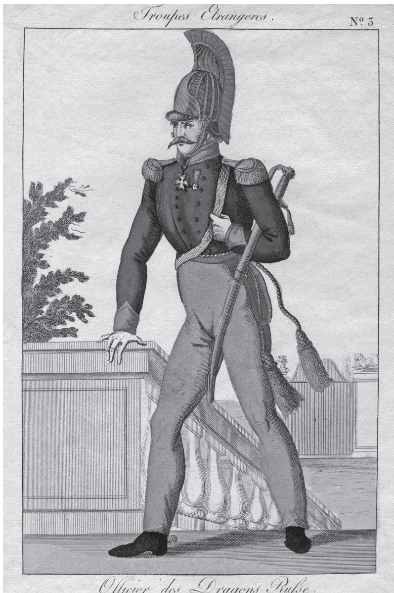
Офицер-драгун времен наполеоновских войн. 1800–1815