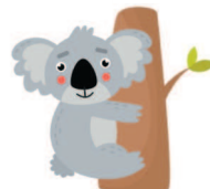
koala [коАла] коала