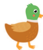
duck [дак] утка