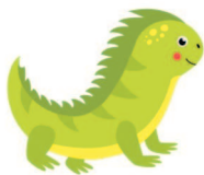
iguana [игуАна] игуана