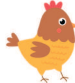
chicken [ЧИкен] курица