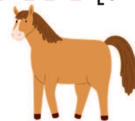
horse [хо:с] лошадь