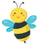
bee [би:] пчела