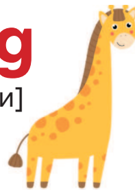
giraffe [джирА:ф] жираф