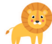
lion [лАйон] лев