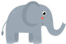
elephant [Элефант] слон