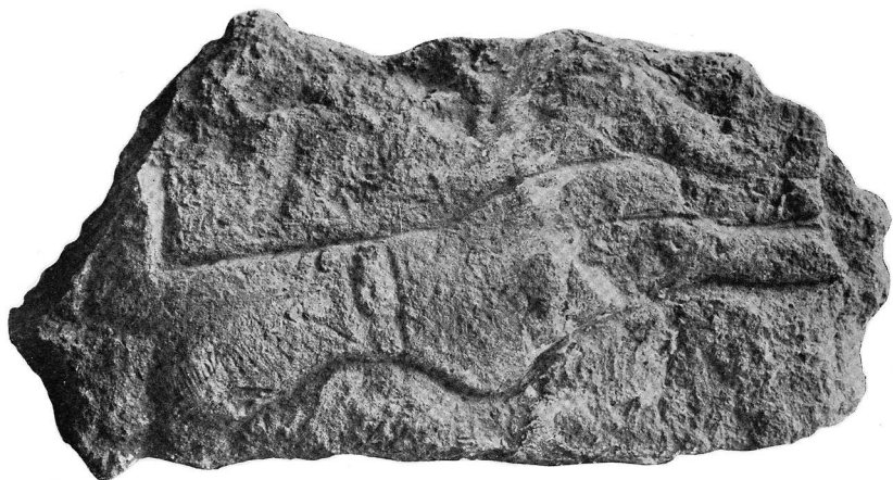
Охотник. Рельеф из пещеры Лоссель. Франция. Около 20 тыс. лет до н. э. Музей Аквитании, Бордо, Франция