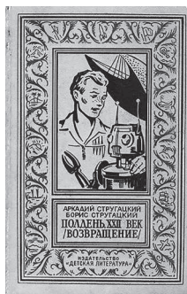
Обложка первого издания романа «Полдень, XXII век (Возвращение)». 1967 г.