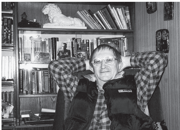
Борис Стругацкий. 1998 г.

советовал: попробуйте мат-мех, там же есть астрономия, а мальчик астрономией интересуется... И я пошел на мат-мех. Там я тоже оказался в толпе медалистов, но на сей раз благополучно поступил, без всяких трудностей, если не считать того обстоятельства, что меня предварительно основательно помучили — вызвали на собеседование самым последним. Впрочем, все это уже были совершенные пустяки. Я не очень горевал, оставшись без своей ядерной физики: как-никак, астрономия тоже была моей любовью, пусть даже и второй, и впоследствии занимался я астрономией и математикой с большим удовольствием и прилежанием» 1 .