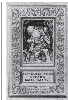
Обложка второго издания повести «Страна багровых туч». 1960 г.