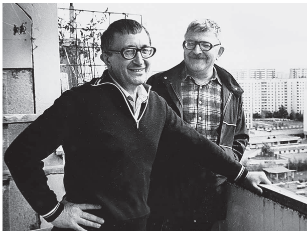
Борис и Аркадий Стругацкие. Москва, 1983 г.

не ежеквартально. Фанфарно отгремел смрадный и отвратительный, как газовая атака, процесс над Синявским и Даниэлем. По издательствам тайно распространялись начальством некие списки лиц, публикация коих представлялась нежелательной. Надвигалось 50-летие ВОСР (Октябрьской революции), и вся идеологическая бюрократия по этому поводу стояла на ушах. Даже самому изумрудно-зеленому оптимисту ясно сделалось, что „Оттепель“ „прекратила течение свое“ и пошел откат, да такой, что впору было готовиться сушить сухари... Сегодняшний читатель просто представить себе не может, каково было нам, шестидесятникам-семидесятникам, как беспощадно и бездарно давил литературу и культуру вообще всемогущий партийно-государственный пресс, по какому узенькому и хлипкому мосточку приходилось пробираться каждому уважающему себя писателю: шаг вправо — и там поджидает тебя семидесятая (или девяностая) статья УК, суд, лагерь, психушка, в лучшем случае, занесение в черный список и выдворение за пределы литературного процесса лет эдак на десять; шаг влево — и ты в объятиях жлобов и бездарей, предатель своего дела, каучуковая совесть, иуда, считаешь-пересчитываешь поганые сребреники... Сегодняшний читатель понять этих дилемм, видимо, уже не в состоянии...»