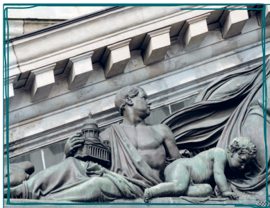
Барельеф, изображающий Огюста Монферрана, держащего в руках модель Исаакиевского собора

фильм об этом и модель лебедок, при помощи которых этот процесс осуществляли. По второй версии, строительство затянулось, потому что архитектору было предсказано, что как только собор будет построен, он умрет. Верите или нет, но спустя сорок дней после освящения собора Огюст Монферран скончался. Однако, возможно, виной тому был не злой рок судьбы. На момент окончания строительства архитектору было 72 года, так что, вероятно, он мог скончаться по естественным причинам. Монферран мечтал быть захороненным в стенах своего детища, но могила католика не место в православном храме, поэтому его воля не была исполнена.