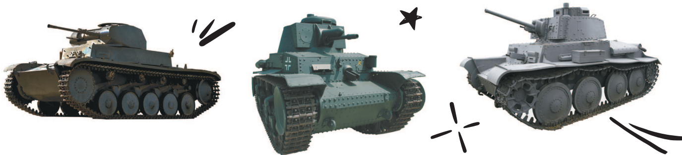
Основу парка танковых частей вермахта летом 1941 года составляли легкие танки (слева направо) Pz II, Pz 35(t) и Pz 38(t).

танковой группы и 9-й армии должна была выйти в район Витебска и Полоцка, а группировка в составе 2-й танковой группы и основных сил 4-й армии должна была овладеть районом Смоленска.