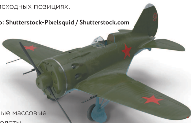
Самые массовые самолеты и танки Красной Армии в начальный период войны — истребители И-16 и легкие танки Т-26.