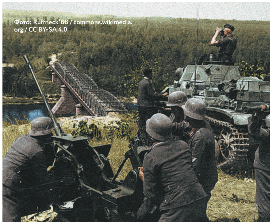
Немецкие солдаты осматривают подступы к мосту.

Ставка Верховного Главнокомандования, видя катастрофическое развитие событий в Белоруссии, попыталась исправить ситуацию. 30 июня был снят с должности генерал Д.Г. Павлов, а 2 июля командующим Западным фронтом был назначен народный комиссар обороны Маршал Советского Союза С.К. Тимошенко. Но перестановками на высших постах добиться желаемого, понятное дело, было невозможно. Тем более что враг усилил свои войска, дополнительно перебросив в Белоруссию 12 пехотных дивизий.