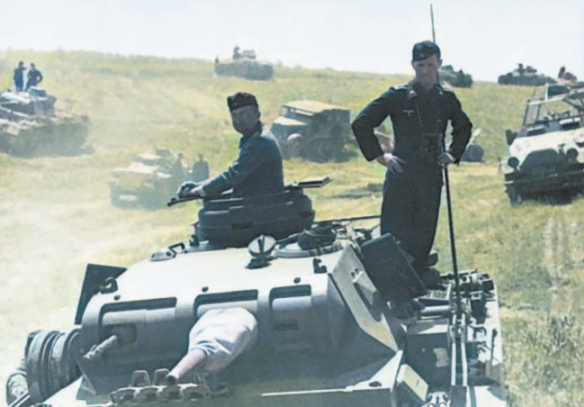
Немецкие войска на исходных позициях.