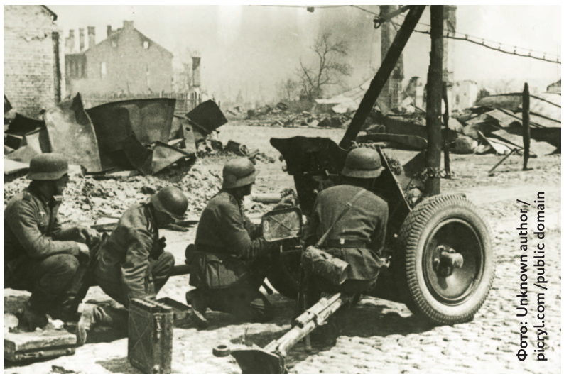
Бой на улицах Гродно.

МЕХАНИЗИРОВАННЫЙ КОРПУС — основное оперативно-тактическое соединение подвижных войск Красной Армии, предназначенное для прорыва обороны противника на всю глубину и способное стремительно развивать оперативный успех. По предвоенным штатам мехкорпус имел около 36 000 человек личного состава, тысячи танков и около пяти тысяч автомобилей. Огромная сила, но, к сожалению, механизированный корпус оказался слишком громоздким и сложным в управлении. К тому же его структура оказалась неоптимальной — слишком много танков и слишком мало пехоты. Поэтому в хаосе начального этапа войны механизированные корпуса Красной Армии не смогли проявить себя и вскоре были реорганизованы.