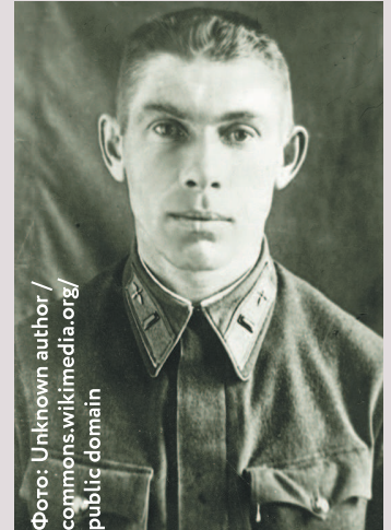
Капитан Н.Ф. Гастелло.