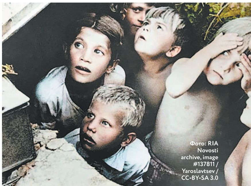
Советские дети во время нацистской бомбежки под Минском в первые дни войны, 24 июня 1941 года.

В начале июля разгорелись упорные сражения на витебском, оршанском, могилевском и бобруйском направлениях. С 1 по 3 июля три немецкие танковые дивизии форсировали реку Березину между городами Березино и Бобруйск и стали развивать наступление на Могилев. Командование врага рассчитывало, что, прорвав оборону на Березине, их танковые части за один день выйдут к Днепру, после чего с ходу захватят переправы у городов Рогачев, Могилев и Орша. Однако на пути к Днепру немецкие войска встретили упорное сопротивление. Части 21-й армии — одной из трех армий созданной в тылу Западного фронта группы армий Резерва Главного Командования — перешли в наступление, форсировали Днепр, освободили города Жлобин и Рогачев и, успешно продвигаясь к Бобруйску, вклинились в расположение противника до 30 км. Немецкое командование отреагировало и, перебросив из резерва к месту боев два армейских корпуса, остановило продвижение