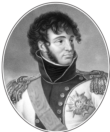
Великий герцог Бергский, король Неаполя маршал Французской империи Иоахим Мюрат (1767–1815)

полеон тотчас же приступил к действиям против Кутузова. Кутузов знал (и доносил Александру), что у Наполеона после Ульма руки совершенно свободны и что у него втрое больше войск 8 . Единственным средством избежать ульмской катастрофы было поспешно уйти на восток, к Вене, а если понадобится, то и за Вену. Но, по мнению Франца, к которому всецело присоединился Александр, Кутузов со своими солдатами должен был любой ценой защищать Вену. К счастью, Кутузов не исполнял бессмысленных и губительных советов, если только ему пред-