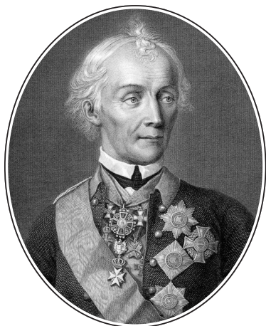
Генерал-фельдмаршал, генералиссимус Александр Васильевич Суворов, князь Италийский, граф Суворов-Рымникский (1729–1800)

Нужно было поддержать Шагин-Гирея против Девлет-Гирея и дипломатически довершить утверждение русского владычества в Крыму. Суворов, откровенно говоривший, что он дипломатией заниматься не любит, сейчас же предоставил Кутузову все эти щекотливые политические дела, которые тот выполнил в совершенстве. Тут впервые Кутузов обнаружил такое умение обходиться с людьми, разгадывать их намерения, бороться против интриг противника, не доводя спора до кровавой развязки, и, главное, достигать полного успеха,