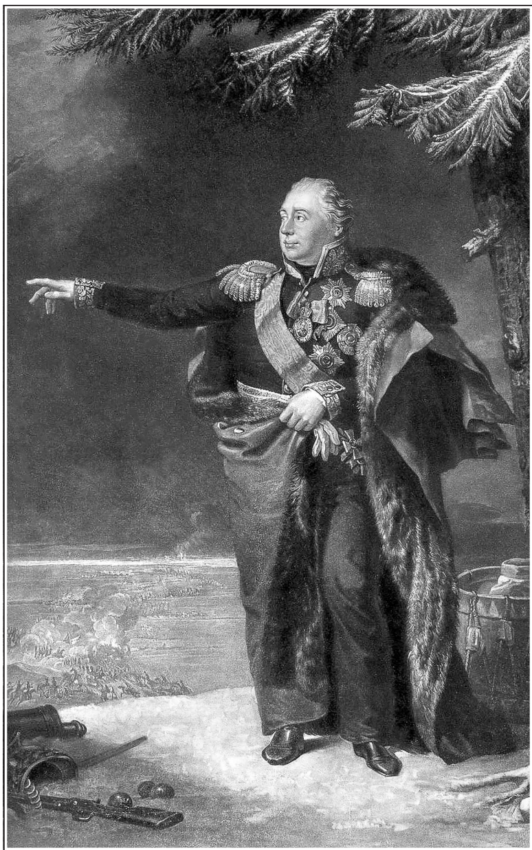
Светлейший князь генерал-фельдмаршал Михаил Илларионович Голенищев-Кутузов-Смоленский Гравюра Г. Э. Доу по картине Дж. Доу. 1825 г.