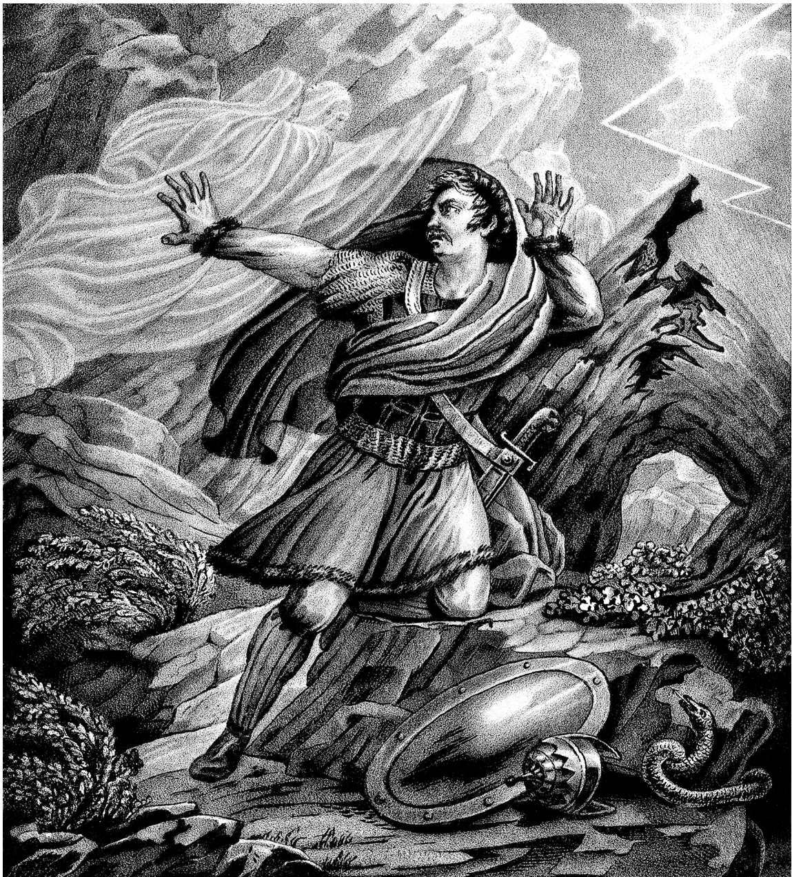
Святополк, терзаемый угрызениями совести.

мех, так как меха были мерилем ценности вещей; отсюда слово «куна» стало означать монетную единицу. Гривна — собственно весовая единица, но в перенесении понятия сделалась крупной монетой, единицей вроде английского фунта стерлингов. Первоначально гривна серебра — фунт, потом, уменьшаясь, дошла около полфунта; гривна