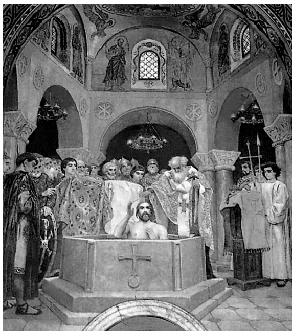
Крещение князя Владимира в Херсонесе (Корсуни). Худ. В.М. Васнецов

пре отчасти потому, что в самом Киеве уже значительно распространено было христианство и христиане не составляли там незначительного меньшинства, а более всего оттого, что у русских язычников не было жреческого сословия, которое бы разъяснило народу преступность такого переворота с языческой точки зрения и возбуждало бы толпу к сопротивлению.