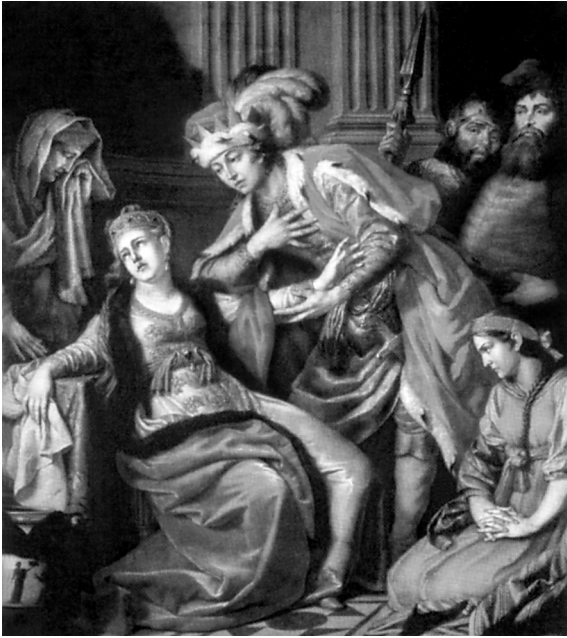
Владимир и Рогнеда. Худ. А.П. Лосенко

черт, в достоверности которых можно скорее сомневаться, чем принимать их на веру. Откидывая в сторону все, что может подвергаться сомнению, мы ограничимся короткими сведениями, которые при всей своей скудости все-таки достаточно показывают чрезвычайную важность значения Владимира в русской истории.