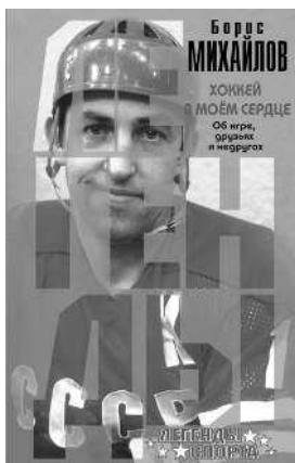
БОРИС МИХАЙЛОВ ХОККЕЙ В МОЁМ СЕРДЦЕ