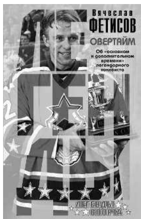
ВЯЧЕСЛАВ ФЕТИСОВ ОВЕРТАЙМ