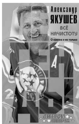
АЛЕКСАНДР ЯКУШЕВ ВСЁ НАЧИСТОТУ