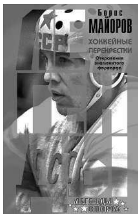
БОРИС МАЙОРОВ ХОККЕЙНЫЕ ПЕРЕКРЕСТКИ