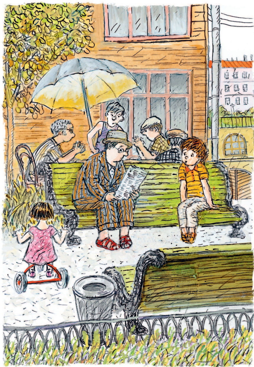
Рисунки Н. Беланова