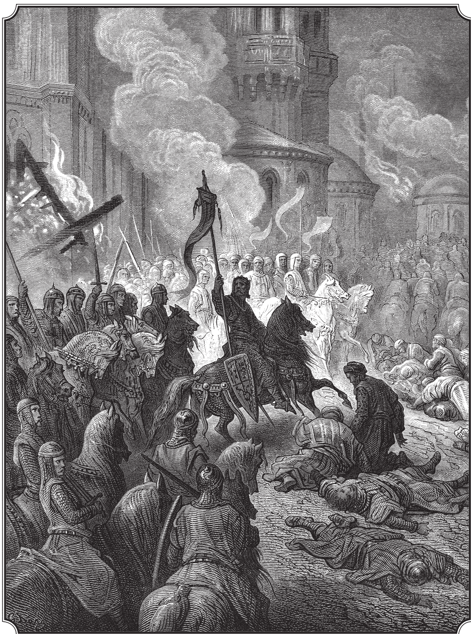
Гюстав Доре. Вступление крестоносцев в Константинополь 13 апреля 1204 г. 1877 г.

так и православных — русских. Годы высшего напряжения двусторонней опасности для Руси — конец 1230-х — 1240 г. Зима 1237—1238 гг. — первый татарский погром Руси (преимущественно Северо-Восточной); в 1240 г. татарами взят Киев (6 декабря). В том же году, побуждаемый папой на крестовый поход против «неверных», шведский правитель и полководец Биргер высадился на берегах Невы (июль). Русь могла погибнуть между двух огней в героической борьбе, но устоять и спастись в борьбе одновременно на два