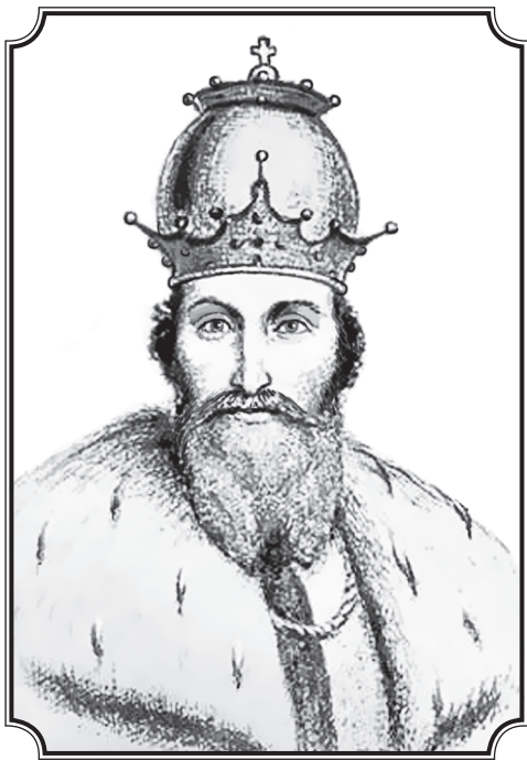
Даниил Романович Галицкий (1202—1264)

Великий галицко-волинский князь. Сын великого галицко-волинского князя Романа Мстиславича и великой княгини Анны.