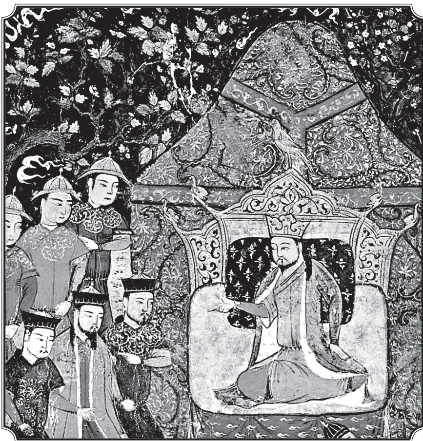
Чингисхан на троне.

сопротивление — наоборот, они побеждали повсюду (при Легнице в Силезии; на реке Солоней в Уграх) — а вследствие внутренних осложнений в глубинах монгольской державы (смерть великого хана Огодая и связанные с этим вопросы престолонаследия и внутренней монгольской политики, живо волновавшие Батюя, руководителя европейского похода монголов). Даниил вернулся на Русь, где ему пришлось вести длительную борьбу с галицкими боярами, перемышльским владыкой, бывшим черниговским князем Ростиславом, уграми и поляками. Борьба шла успешно и завершилась решительной победой Даниила над польскими и угорскими войсками Ростислава (под Ярославом, 1249 г.). Между тем уже в следующем (1250) году монголы вновь заинтересовались Юго-Западной Русью. Батый прислал сказать Даниилу: «Дай Галич». Не чувствуя себя опять в силах бороться оружием, Даниил решил подчиниться и поехал сам к Батюю. Против ожидания Даниил был встречен ласково. Войдя в вежу (палатку) Батюя, Даниил поклонился по монгольскому обычаю. Батый сказал ему: «Даниило, чему еси давно не пришел? А ныне оже еси пришел, то добро же. Пьеши ли черное молоко, наше питье — кобылий кумыс?» Даниил: «Доселе семь не пил — ныне же ты велишь — пью». Батый: «Ты уже наш татарин, пей наше питье». Даниил выпил и поклонился по обычаю. Потом Батый прислал Даниилу вино, сказав: