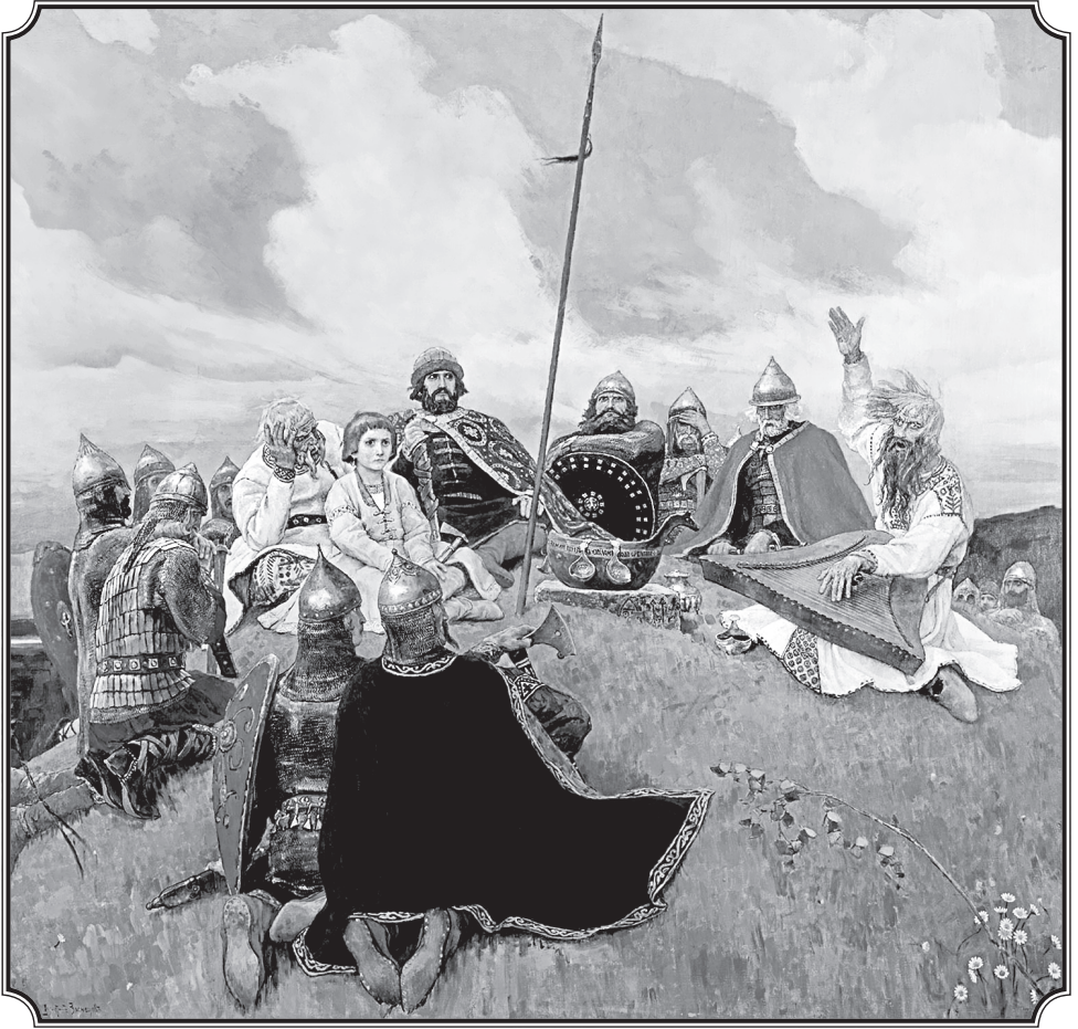
В. М. Васнецов. Боян. 1910 г.

Боян (Баян) — древнерусский певец и сказитель, «песнотворец». Как «творец песен» Боян назван в зачине «Слова о полку Игореве»: «Боянь бо вещей, аще кому хотяше песнь творити, то растекашется мыслью по древу, серым вълком по земли, шизым орлом под облакы...». Кроме «Слова...», Боян упоминается и в «Задонщине».