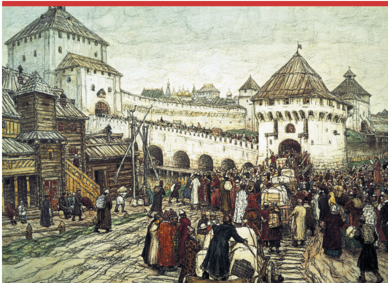
А.В. Васнецов. В осадное сиденье. Троицкий мост и башня Кутафья. 1915

Представим себе, что враг подходит к крепости. Самое уязвимое место в ней — это, конечно, воротная башня. Ведь ворота — это уже готовое отверстие, в которое можно ворваться! Чтобы защитить воротную башню, перед ней ставили отводную — от слова «отводить» (врага). Она первая принимала