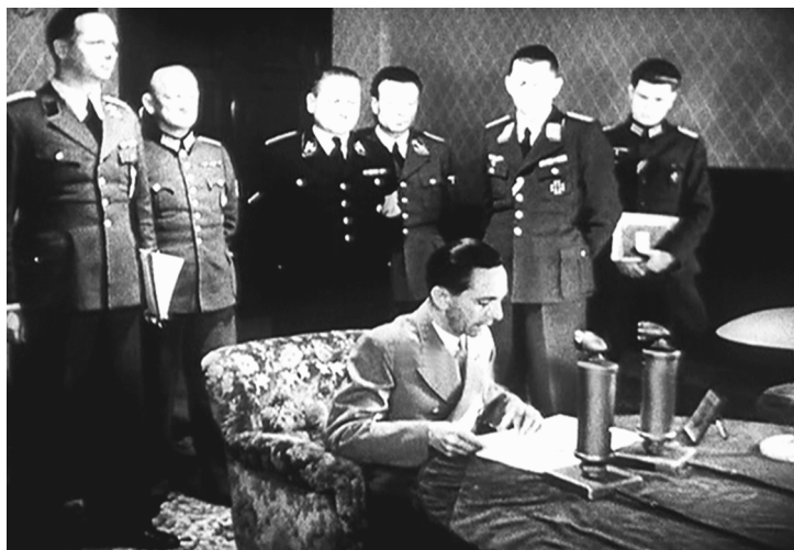
Имперский министр народного просвещения и пропаганды Йозеф Геббельс зачитывает обращение Гитлера к народу.

Их прославляли в фильмах — таких, как «Горячие денечки», «Если завтра война», «Истребители», «Эскадрилья номер пять» и других. Романтичные образы танкистов и летчиков создавали такие суперзвезды советского кино, как Николай Крючков, Николай Симонов. Крючков в «Трактористах» играет демобилизовавшегося танкиста, для которого «на гражданке» открыты любые дороги. Ключевой момент фильма — рассказ его героя, Клима Ярко, колхозникам о скорости и мощи танков. Картина завершается сценой свадьбы танкиста и лучшей девушки колхоза. В финале вся свадьба поет популярнейшую песню тех времен: «Броня крепка, и танки наши быстры». «Горячие денечки» рассказывает о танковом экипаже, остановившемся для ремонта