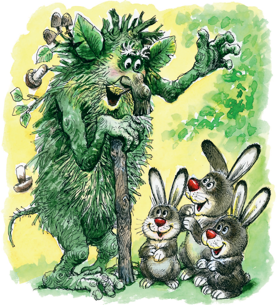
Рисунки А. Савченко