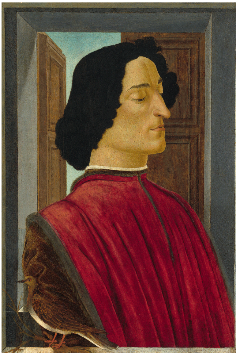
Сандро Боттичелли, портрет Джулиано Медичи, 1478-80 гг.