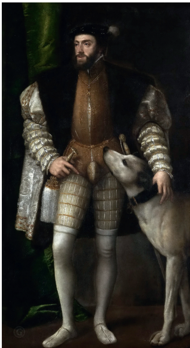
Тициан, портрет Карла V с собакой, 1533 г.