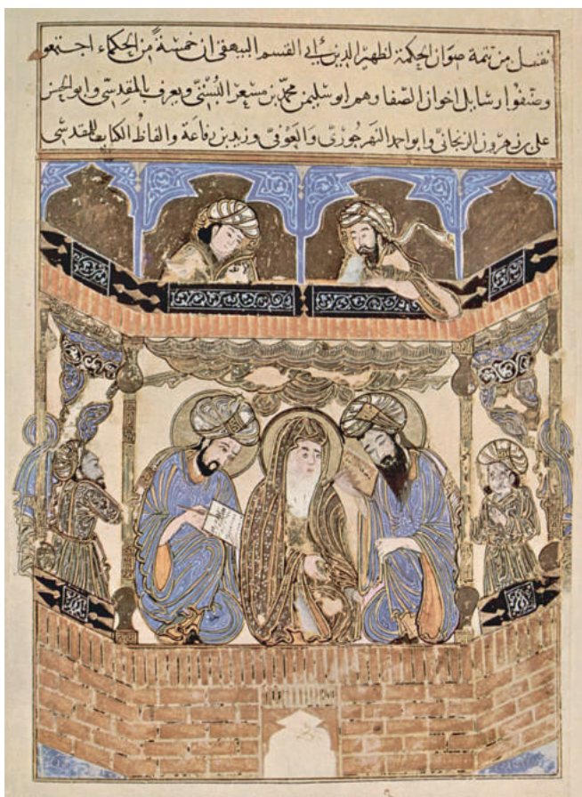
Рукопись Корана из Аль-Андалуса. Более толстые штрихи в центре страницы выполнены в кувфическом стиле. XII век.