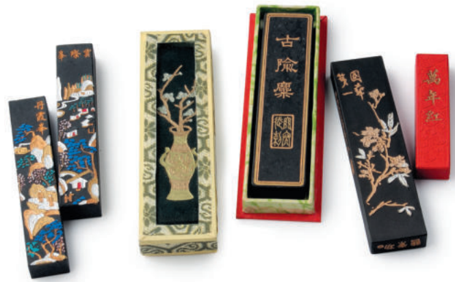
Четыре сокровища китайского каллиграфа: чернила, кисти, чернильница и бумага.

Для занятий китайской каллиграфией нам понадобится минимум материалов, так называемые «четыре сокровища рабочего стола»: рисовая бумага, китайские кисти (би), китайские чернила (суми) и каменная чернильница (судзури); а также основные инструкции перед написанием. Планировка рабочего места также очень важна. Все принадлежности должны находиться под рукой, разложите их на очень устойчивом столе на удобном для вас расстоянии, но достаточно далеко от бумаги, чтобы не испачкать ее. Поскольку рисовая бумага очень тонкая и чернила часто просачиваются сквозь нее, во избежание загрязнения поверхности стола и получения большей плотности штриха желательно подложить под бумагу кусок черного фетра.