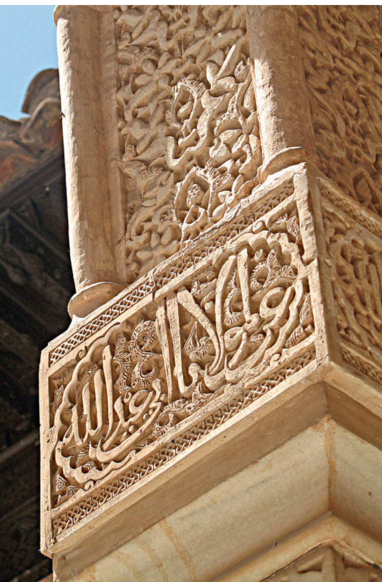
Деталь арки в Альгамбре, полностью украшенная каллиграфией (Гранада, Испания).

Басмала, или каллиграфическая композиция, созданная шейхом Азизом ар-Руфаем. Чаще всего басмалы встречаются в Коране, но они получили широкое распространение в декоративных целях, как в случае с этой каллиграфической композицией в форме груши.