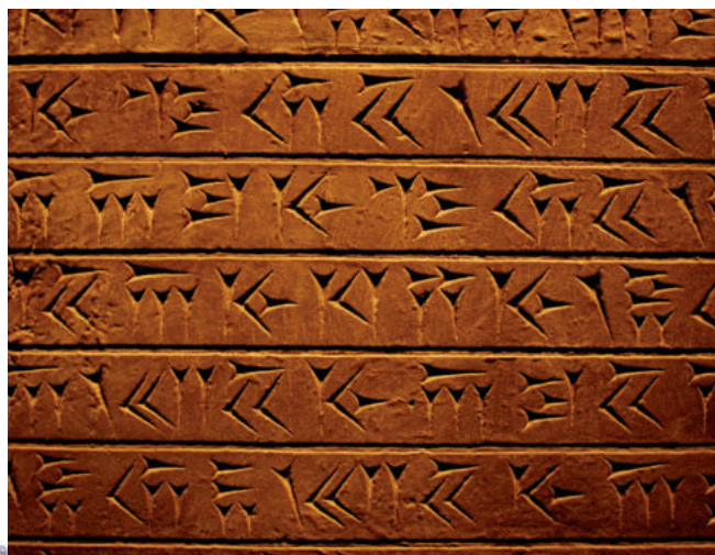
Клинопись под увеличением. Британский музей, Лондон.

Самые большие таблички содержали одиннадцать колонок и имели площадь около 929 см 2 . Одна из сторон таблички была гладкой, а другая — выпуклой. Такая форма была необходима, чтобы предотвратить стирание написанного при повороте таблички и давлении при записи на другой ее стороне. Позднее, помимо глины, для письма стали использовать и другие материалы: камень, глиняные горшки, покрытые воском панели. Клинопись позже была перенята вавилонянами, эламитами, хеттами, ассирийцами и аккадцами. Везде, где использовался шумерский язык, клинопись была основным способом письменного общения.