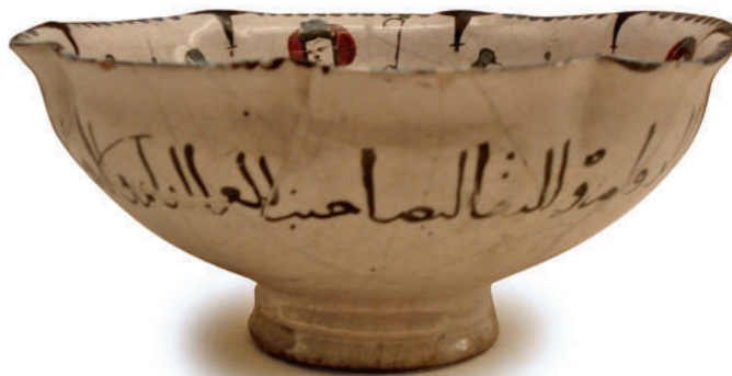
Фрагмент надписи на арабском языке на металлизированной керамике из Персии. Начало XIV века. Фонд Галуста Гюльбенкяна (Лиссабон, Португалия).