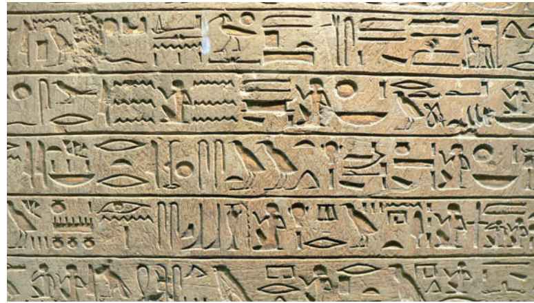
Миннахт (деталь). Рельеф на известняке. 1323 г. до н. э. 1,48 × 0,89 × 55 м). Лувр, Париж (Франция).

Единого мнения о происхождении египетских иероглифов нет. Подобно тому как это произошло с клинописью, египетские иероглифы, вероятнее всего, появились внезапно примерно в 3150 году до н. э. Нельзя