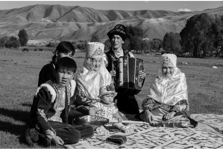
Казахи в традиционной одежде в горах Тянь-Шань. Казахстан

Перед вашими глазами развернется захватывающая история казахского народа. Вы узнаете, кто такой великий Тенгри и в чем кроется сакральный смысл тенгрианства, отголоски которого до сих пор живы в традициях и обычаях казахов. Вы услышите страстные напевы кобыза и поймете, почему его воздействие на слушателя неодолимо. Вы повстречаетесь с ужасной албасты, добрыми момо и многими другими персонажами, населяющими многообразную вселенную казахской мифологии. Вы с головой погрузитесь в совершенно новый и удивительный мир сказочной гармонии, свободы и по-детски волшебного восприятия окружающей действительности.