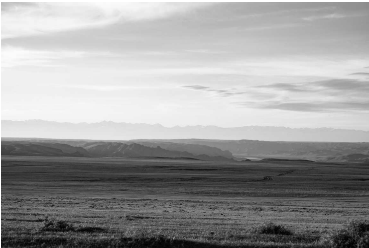
Степь Алма-Атинской области. Казахстан

Дети степей, казахи-кочевники, благоговейно относились к любому живому существу, наделяя душой все вокруг — и былинку травы, и дерево, и птицу, и дикого зверя. Возможно, ни в каком ином фольклоре вы не найдете столько мифов о происхождении пустынь, озер, рек и скал. Кажется, любая крохотная сопка или незаметный горный ручеек готовы поделиться с путником грустной или забавной историей о противостоянии человека и коварного демона, сражении храброго ба-