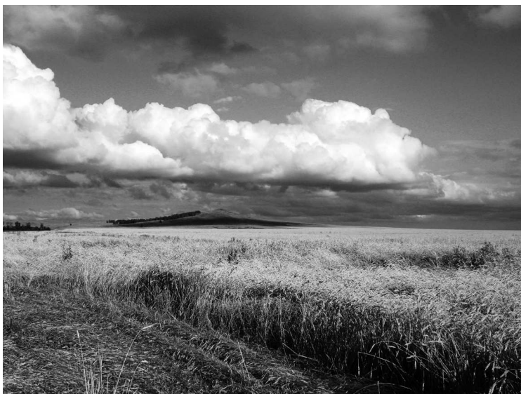
Зерновые поля близ Кокшетау. Казахстан

К ак море безбрежна и необъятна Великая степь. Много загадок и тайн хранит она. Вольно мчатся по ее сочной траве на легконогом скакуне-тулпаре, перегонять стада в долинах полноводных рек или неспешно кочевать на спине верблюда по выжженной солнцем пустыне, грезя о спасительном оазисе с прохладной водой. Тяжела жизнь кочевника, но вместе с тем нетороплива и благодатна: все в его жизни естественно и гармонично, все движется и действует в согласии с универсальным небесным законом. Найдено свежее пастбище — ставятся юрты, образуются аул, пасутся табуны, стада и отары. Оскудевает