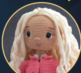
ВОЛШЕБНИЦА- МЕЧТАТЕЛЬНИЦА С. 229