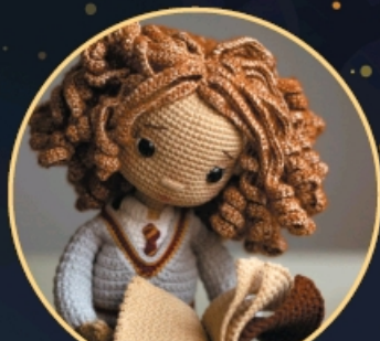
ВОЛШЕБНИЦА- ВСЕЗНАЙКА С. 149