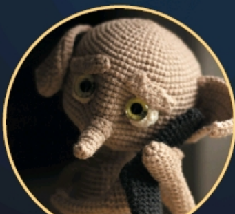
ДОМОВОЙ ЭЛЬФ С. 207