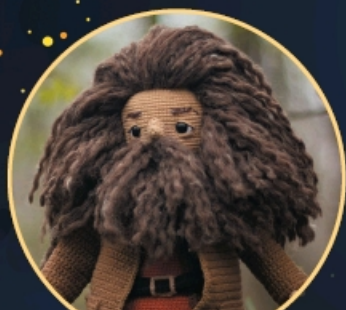
ЛЕСНИК- ВЕЛИКАН С. 181