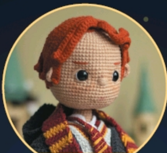
ЛУЧШИЙ ДРУГ С. 115