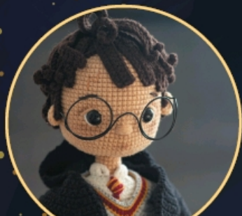
ЗНАМЕНИТЫЙ ВОЛШЕБНИК С. 75