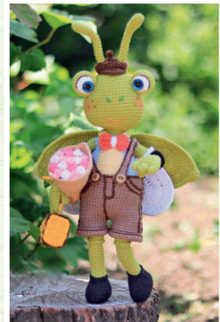
Кузнечик Кузя 101