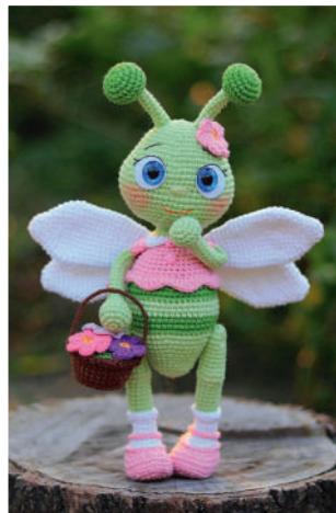
Стрекоза Соня 83