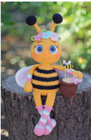
Пчелка Майя 65