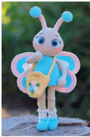
Бабочка Элина 33