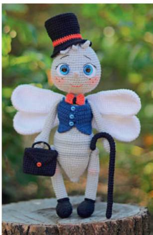
Комар Митя 119