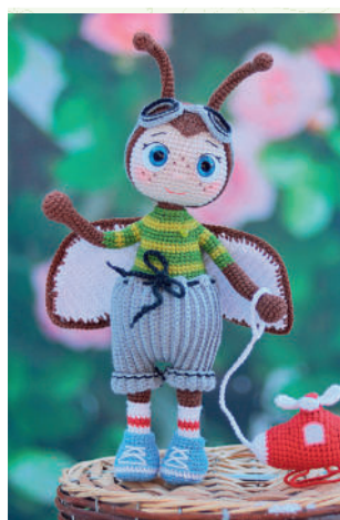
Жучок Тима 135