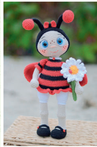
Божья коровка Мила 49