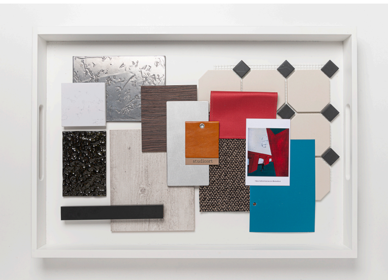
Мудборд кухня-гостиная Библиотека материалов «Практика» simplelibrary.ru