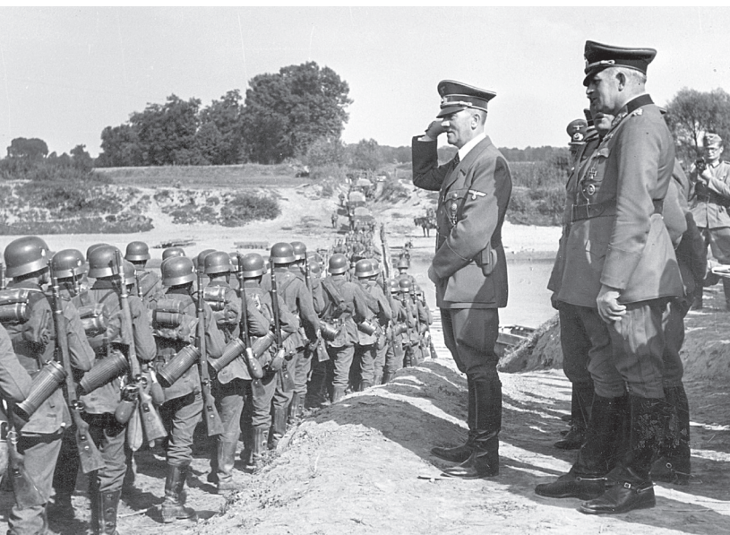
Адольф Гитлер приветствует немецкие войска, переходящие мост через реку Сан (правый приток Вислы) в районе Ярослава в Польше 15 сентября 1939 г.

по Германии и стал важнейшим фактором прихода Гитлера и нацистов к власти в 1933 году. Поставил цель формирования нового европейского и мирового порядка, который включал в себя освобождение Германии от военных ограничений Версальского договора, «собрание немецких земель», уничтожение евреев. На следующем этапе – в союзе с Италией и Японией – уничтожение Франции, захват и колонизация Советского Союза и истребление большей части его «расово неполноценного» населения, сокрушение Великобритании с захватом ее колоний и создание предпосылок для мирового господства «германо-арийской» расы.