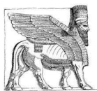
18. Крылатый лев из Шанси.