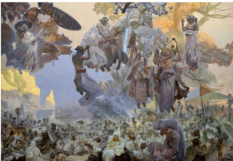
Альфонс Муха. Праздник Свентовита. Когда боги воюют, спасение — в искусстве. 1912 г. Музей Альфонса Мухи. Прага, Чехия