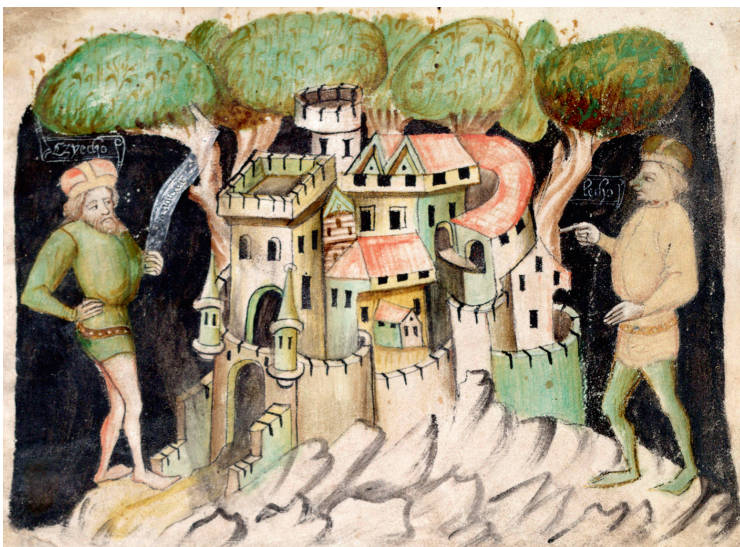
Изображение легендарных Чеха и Леха на фоне Пражского Града, вклеенное в Будишинский список. XIV в. Хроника дала начало легенде о трех славянских братьях, впервые представив Чеха прародителем чешского народа