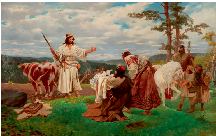
Франтишек Женишек. Наследие Либуше и Пршемысла-пахаря. 1891 г. Национальная галерея. Прага, Чехия