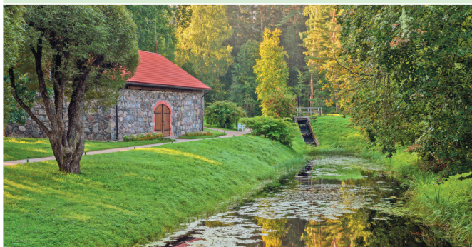
Пруд усадьбы Михайловское