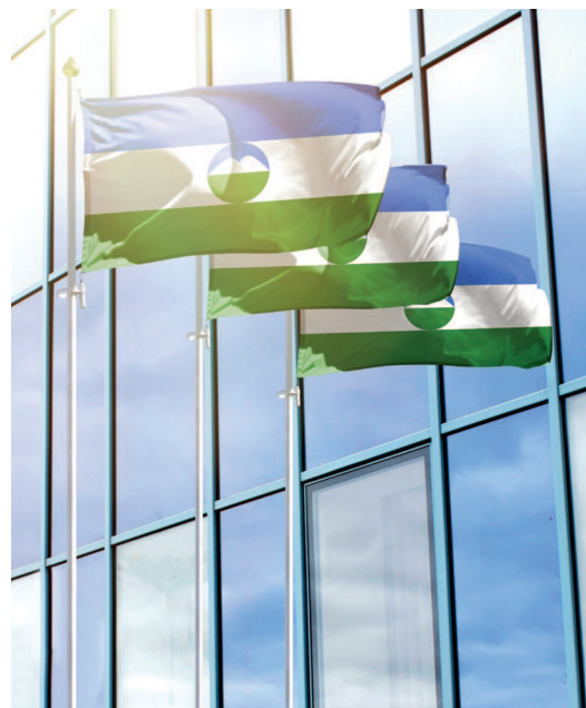
Флаги Кабардино-Балкарской Республики рядом с административным зданием

Кабардинцы и балкарцы, проживая на смежных территориях, сильно различаются по языку, происхождению, традициям и укладу жизни. Кабардинцы близки к черкесам и адыгейцам, с которыми их связывают общие этнокультурные корни и схожие обычаи. Они говорят на кабардино-черкесском языке, одном из языков абхазо-адыгской семьи, отличающемся богатой системой согласных и сложной грамматикой. Балкарцы, в свою очередь, восходят к древним аланам, со временем смешавшимся с тюркскими племенами и другими кавказскими народами. Их