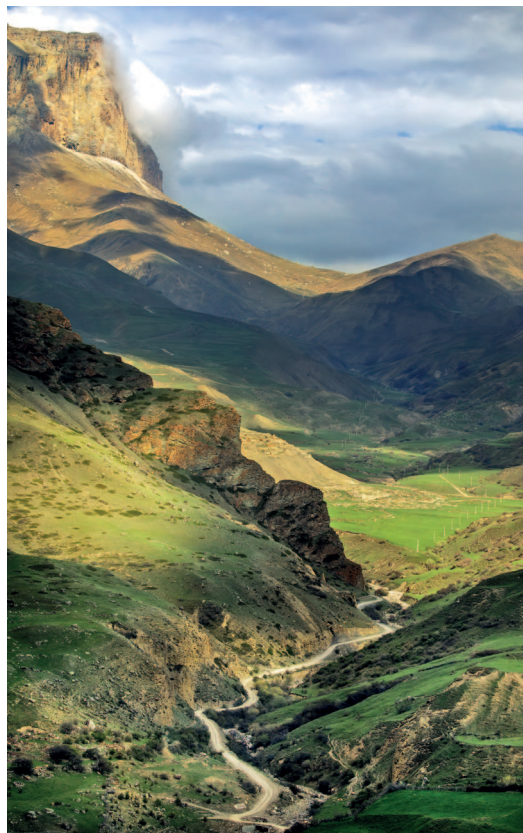
Горы здесь и вправду упираются в небо

Во время Великой Отечественной войны тысячи кабардинцев и балкарцев сражались на фронтах, защищая страну. Война пришла и на территорию республики: в 1942 году немецкие войска продвинулись к Приэльбрусью, стремясь взять под контроль стратегически важные горные перевалы. Их целью был вы-