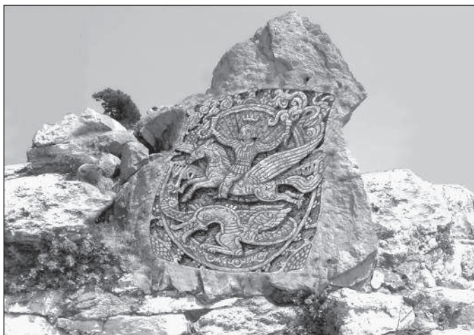
Бус на Единороге. «Образы Русколани»

3 И съде о Вѣлицей Латырь-горѣ имѣхомъ ѡдолъ съ травы значны, иде же цвѣташеть вертъ Ирїйскъ, и течашѡтъ воды живѣ. И овѣдѣ потаеное сътворѣтсѧ, и никъто же не ѡмьрашеть.