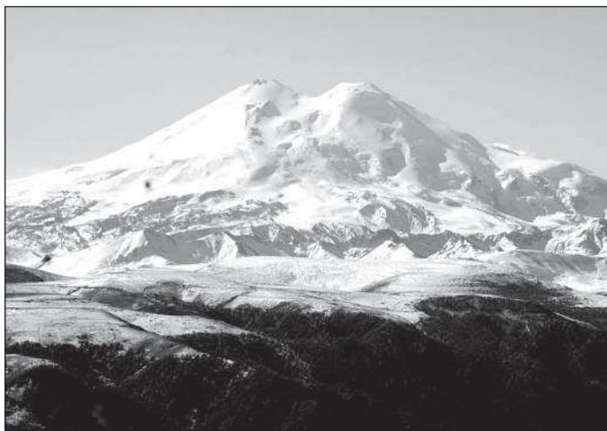
Великая Алатырь-гора (Эльбрус)

3 И есть здесь у Великой Алатырь-горы долина со злачными травами, где цветёт сад Ирийский, и течёт вода живая. И здесь тайное творится, и никто не умирает.