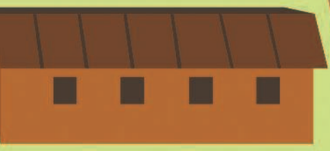
Укрытие от снега и дождя