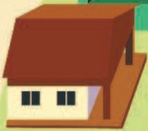
Кафе для посетителей зоопарка