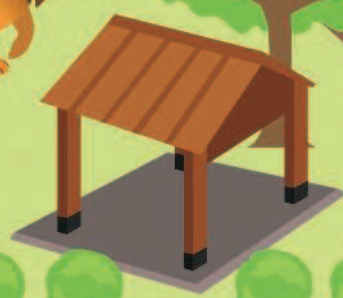
Укрытие от солнца