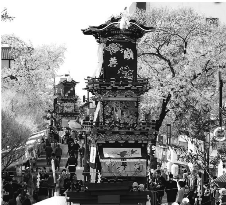
Праздник в честь цветения сакуры в городе Инуяма

равнины, где проживает большая часть населения, чрезвычайно плодородны. В Центральной и Южной Японии выпадает огромное количество дождей. Влажным жарким летом ростки риса и бамбука увеличиваются практически на глазах.