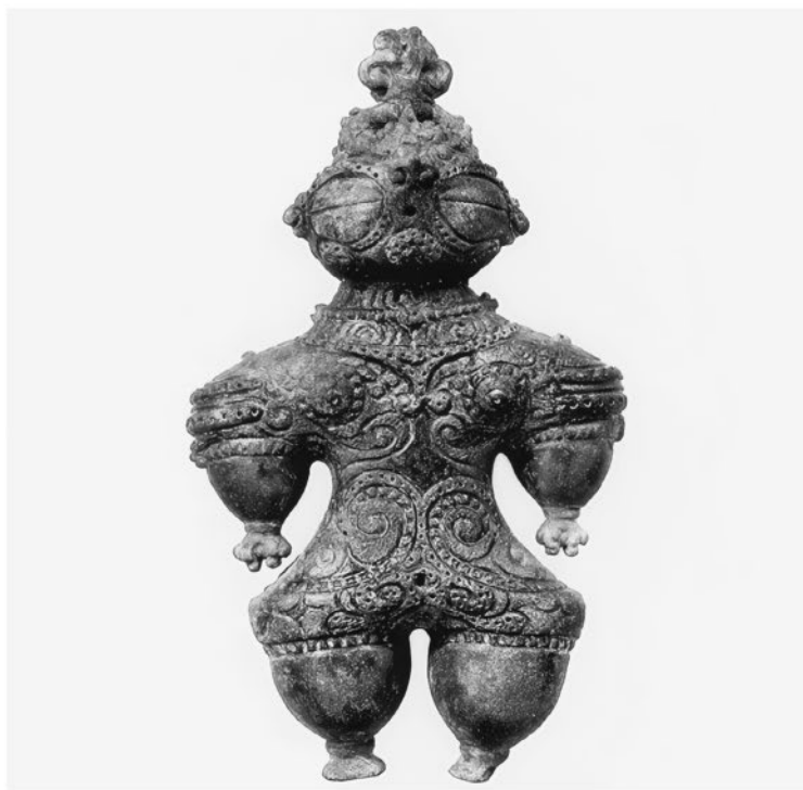
Догу. Поздний Дзёмон (1000–300 г. до н. э.). Найдена в Камзгаоке, недалеко от Саннай-Маруямы. Фигурка полая внутри. Изначально она была окрашена красным пигментом, следы которого заметны до сих пор

когда шаман, поев галлюциногенных грибов или выпив хмельной напиток, входил в транс и общался с духами, прося их послать удачу во время охоты и рыбной ловли, защитить от извержений вулканов, от тайфунов, наводнений и землетрясений.