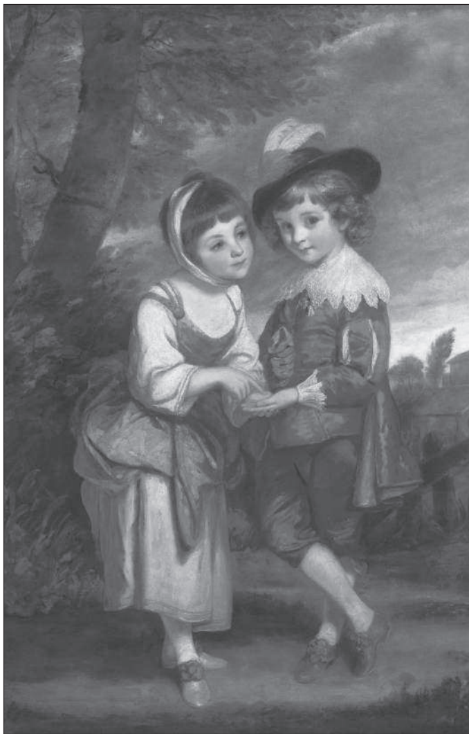
Дети гадают друг другу по руке на портрете английского художника XVIII в. Дж. Рейнольдса