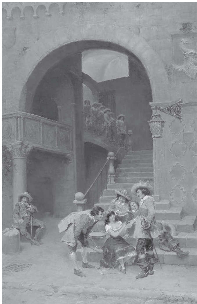
Ф. Бергамини. Гадалка