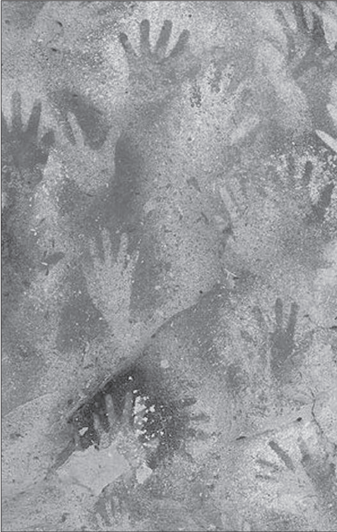
Отпечатки рук людей эпохи палеолита