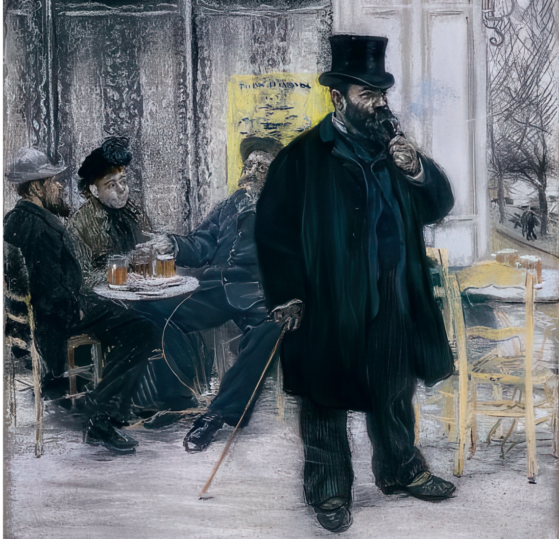
■ Эдуард Мане. В кафе «Гербуа». Литография. 1869

районе Парижа с низкой арендной платой. Имена же участников группы красноречиво показывают, что её ядро — будущие импрессионисты.