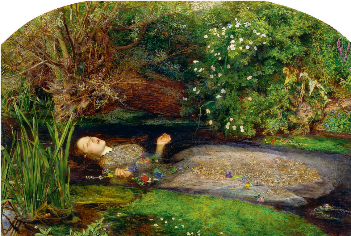
■ Джон Эверетт Милес. Офелия. 1852