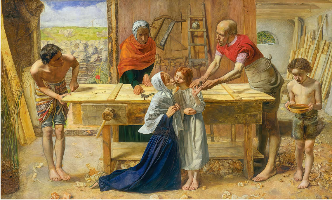
■ Джон Эверетт Милес. Христос в родительском доме. 1850

у содержанки, покорно сидящей на коленях какого-то состоятельного шалопа.