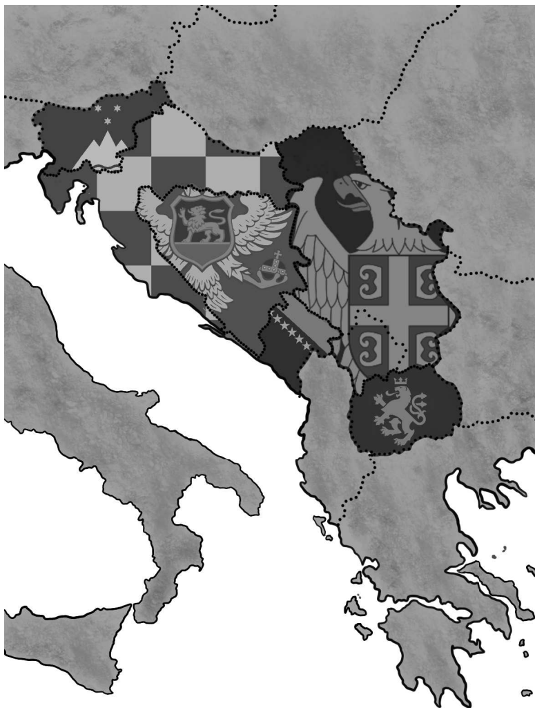
Рисунок: Сербия, Хорватия, Босния и Герцеговина, Словения, Черногория и Македония.

и сформировали новое правительство Югославии, которая состояла из шести республик.