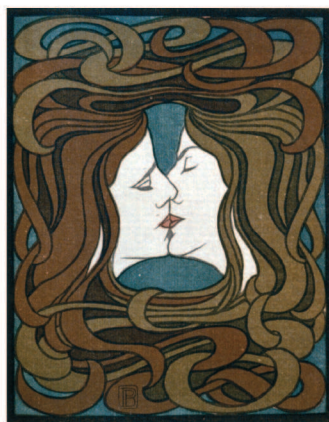
СВЕРХУ: Обри Бёрдслей, плакат, 1894