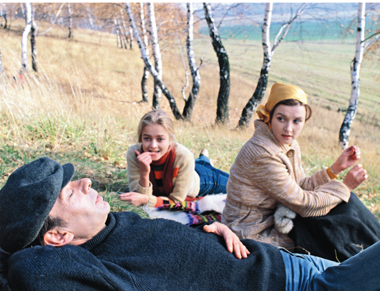
К/ф «Москва слезам не верит», Реж. Владимир Меньшов © Киноконцерн «Мосфильм», 1979 год.

САМ МЕНЬШОВ В ЧЕРНОЙ ШЛЯПЕ И ПЛАЩЕ ТОЖЕ ПОЯВЛЯЕТСЯ В ЭТОЙ СЦЕНЕ.