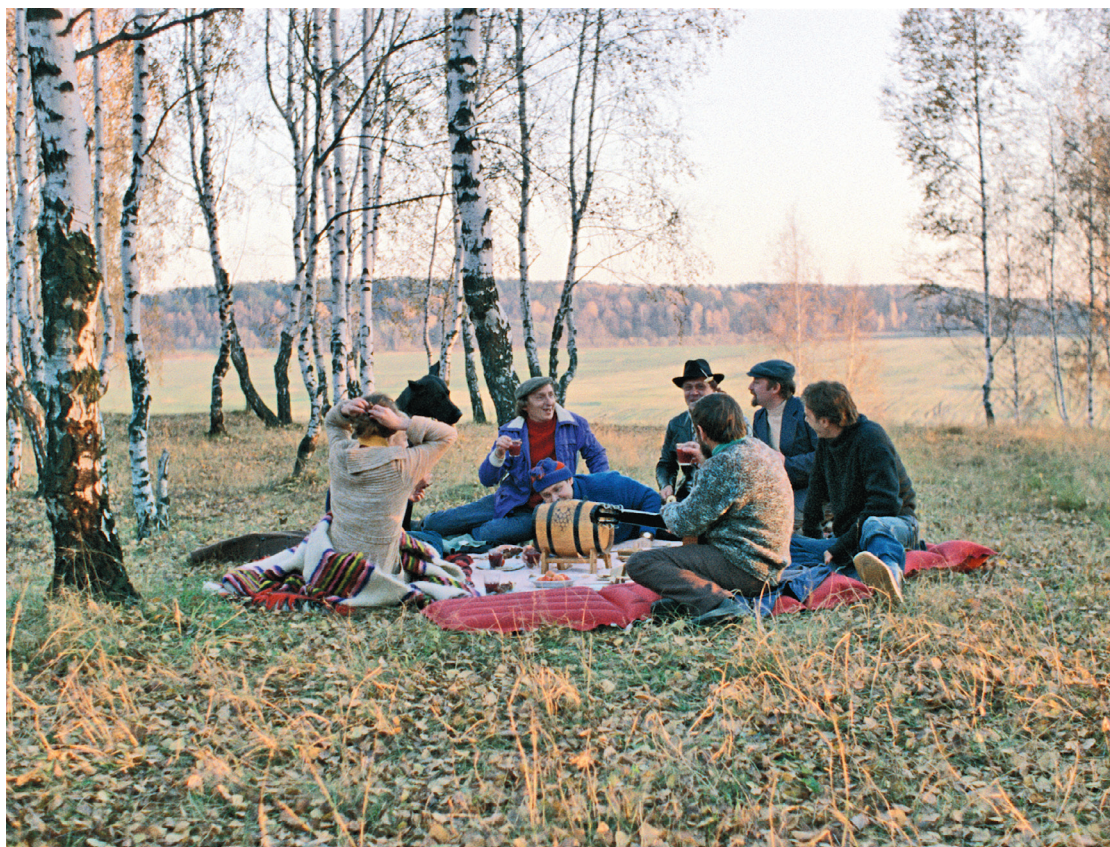
К/ф «Москва слезам не верит», Реж. Владимир Меньшов