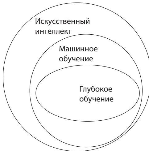
Рис. 1.1. Отношения между искусственным интеллектом, машинным обучением и глубоким обучением

Искусственный интеллект как раздел компьютерных наук возник в ходе семинара в Дартмутском колледже летом 1956 года. Там были представлены исследования в разных областях, включая доказательство математических теорем, анализ естественного языка, планирование в играх, компьютерные программы, способные обучаться на примерах, и нейронные сети. Современная область машинного обучения основана на последних двух направлениях.