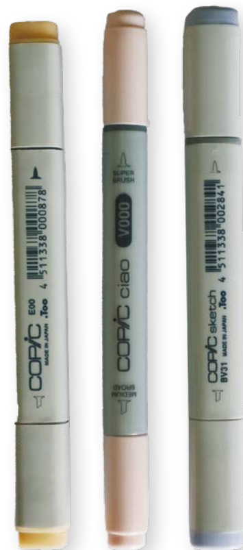
Маркеры слева направо: Copic Classic E00, Copic Ciao V000 и Copic Sketch BV31.

Продукция Copic, пожалуй, самая дорогая на рынке, но в этом случае цена более чем оправдана. Если есть возможность, попробуйте хотя бы разок порисовать «копиками». Однако знакомство со спиртовыми маркерами я бы советовала начать с других брендов. Более бюджетные маркеры помогут вам привыкнуть к этому материалу и понять, как вы хотите с ним работать. Кроме того, кисть у маркеров Copic довольно мягкая. Ею можно проводить линии разной толщины, но к работе с таким пером нужно привыкнуть. Если вы уже рисовали спиртовыми маркерами, обязательно попробуйте «копики». Цвета у них действительно потрясающие!