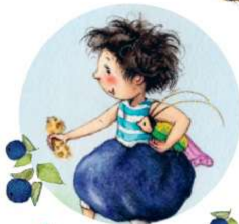
• Черничная фея •