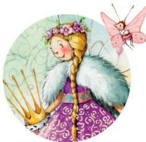
• Королева Фей •