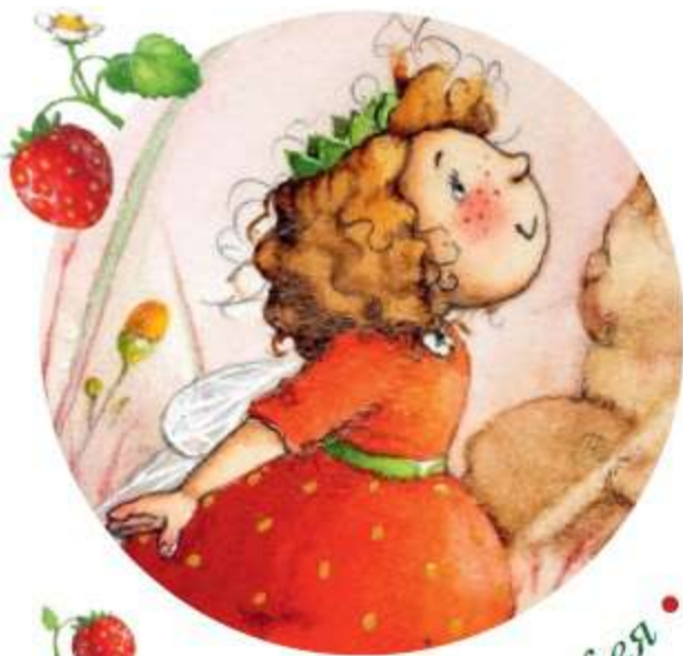
• Земляничная фея •