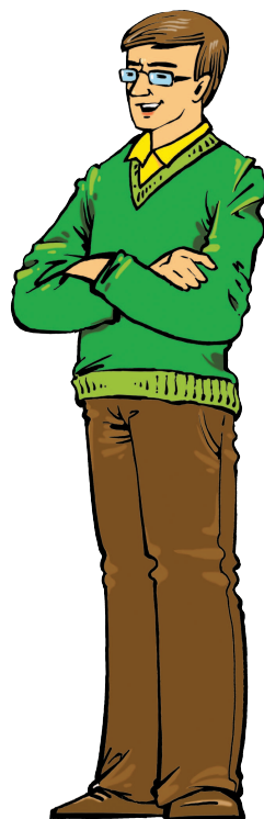
father [ФА:ЗЭ] отец