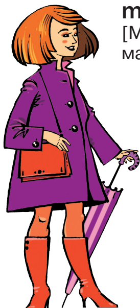
mother [МАЗЭ] мать