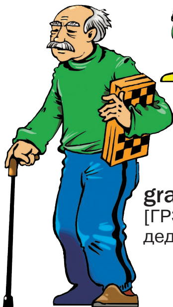
grandfather [ГРЭНФА:ЗЭ] дедушка