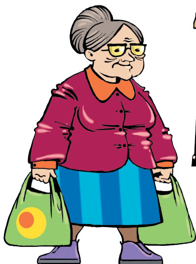
grandmother [ГРЭНМАЗЭ] бабушка