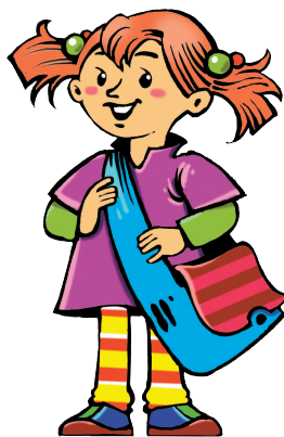
daughter [ДО:ТЭ] дочь