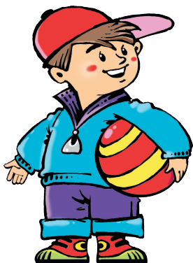
son [САН] сын