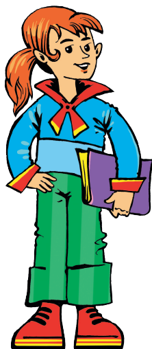
sister [СИСТЭ] сестра