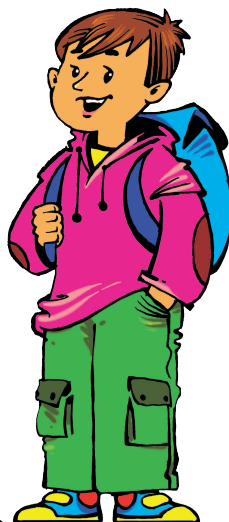
brother [БРАЗЭ] брат