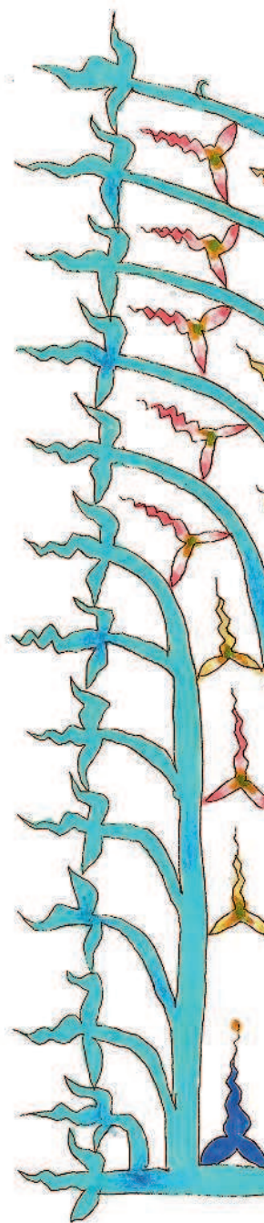
Рис. М. Майофиса .....261