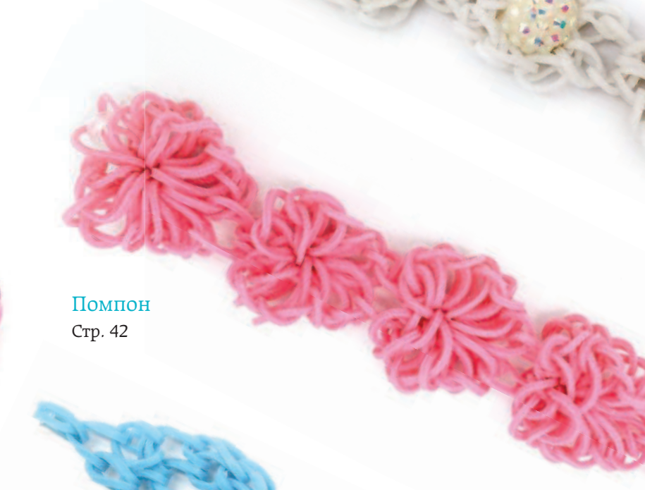
Помпон Стр. 42