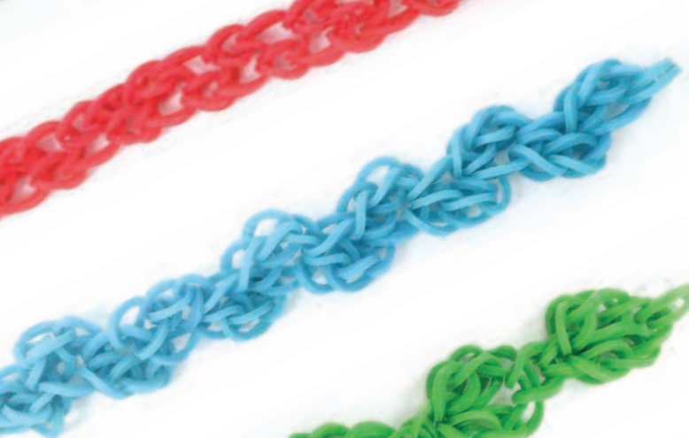
Рокот волн Стр. 24