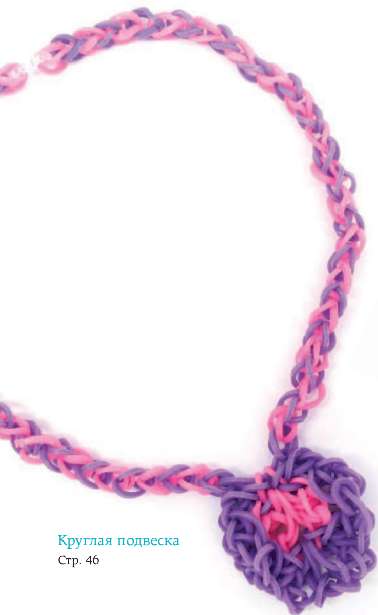
Круглая подвеска Стр. 46