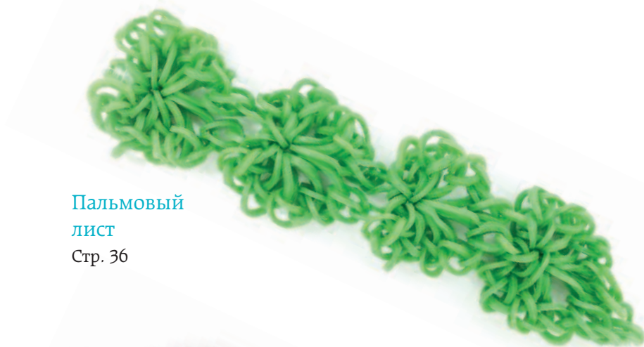
Пальмовый лист Стр. 36