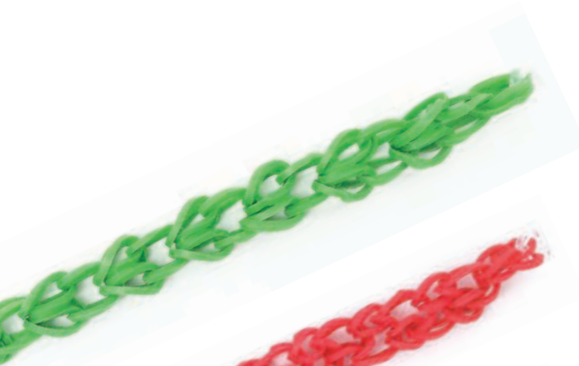
Листочек Стр. 19