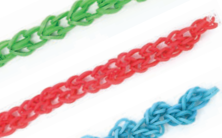
Дождливый денек Стр. 21