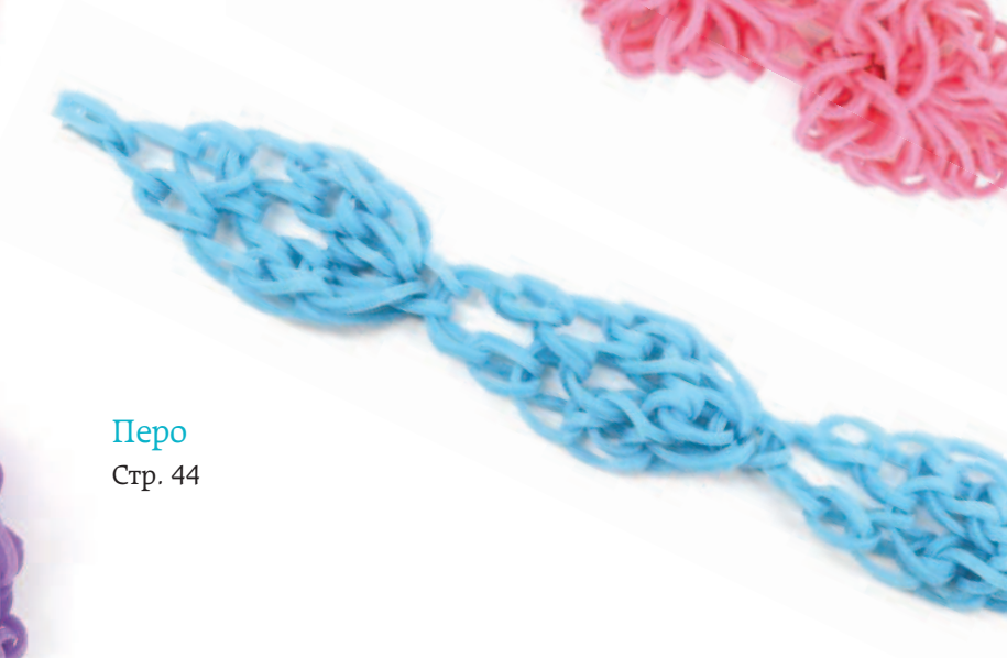
Перо Стр. 44