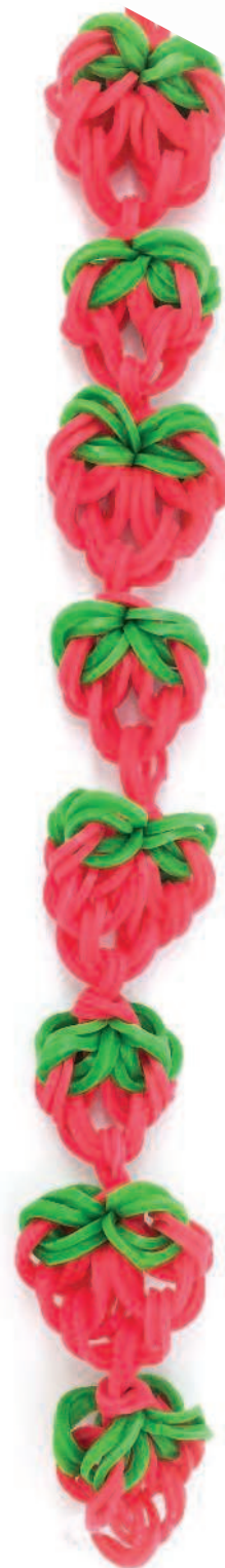
Клубника Стр. 34