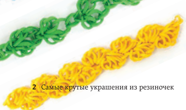
Половинка ракушки Стр. 29