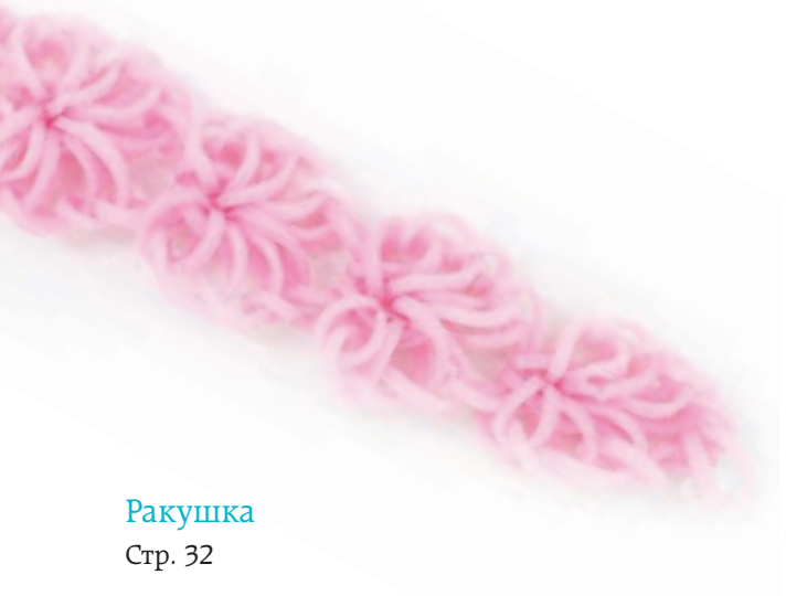
Ракушка Стр. 32