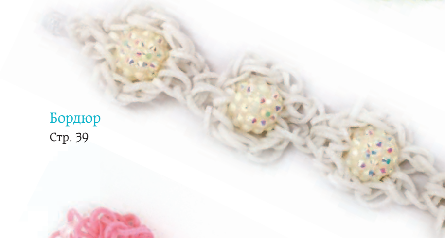
Бордюр Стр. 39