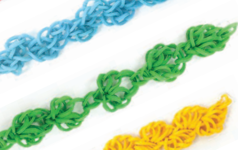
Вьюнок Стр. 27